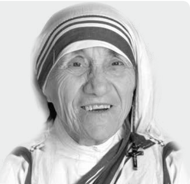
MADRE TERESA DE CALCUTÁ

“ Nunca se preocupe com números. Ajude uma pessoa de cada vez e comece pela mais próxima: você! ”.