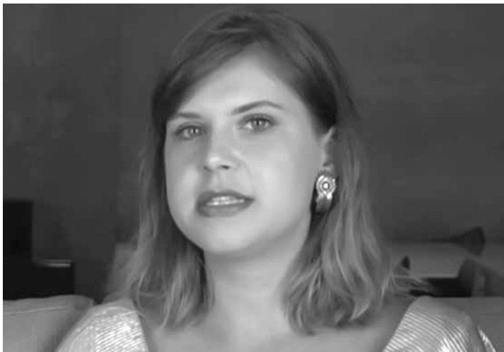
Carolinie Figueiredo fez sucesso em 'Malhação', de 2007

“Lembro que quando eu estava na televisão, eu olhava para todo mundo da cena, e só eu estava acima do peso. Eu comecei a criar crenças de que aquele lugar não era para mim. Eu era a única diferente. Só que, ao mesmo tempo, eu olhava para quem estava atrás das câmeras, para minhas amigas e minha família, e o corpo era mais parecido com o meu. Eu ficava sem entender, mas na minha cabeça eu era a errada. E chegava para a prova de roupa, não tinha nenhuma que cabia no meu corpo, no meu quadril (...) De alguma maneira, ficou em mim mágoa de que não sou daquele lugar”.