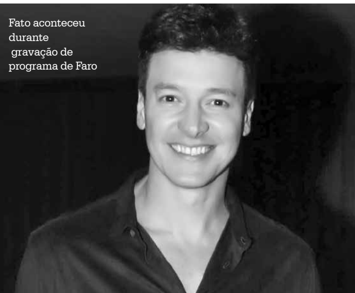
Fato aconteceu durante gravação de programa de Faro