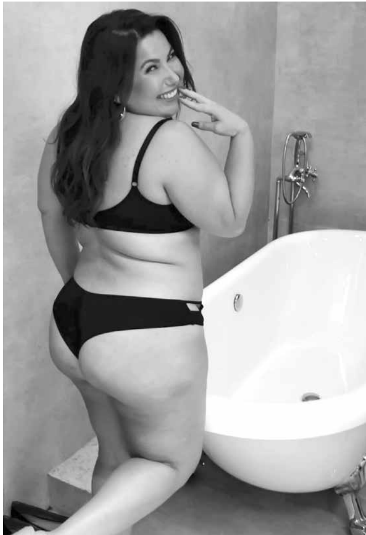
A imagem já teve mais de 100 mil curtidas e dois mil e quinhentos comentários

O post já teve mais de 100 mil curtidas e dois mil e quinhentos comentários. Entre eles, pessoas elogiando a atriz. “Musa que inspira”, comentou uma usuária da rede. “Que corpo lindo. Eu me acho linda gordinha e meu esposo também. Continue se amando assim”, escreveu outra.