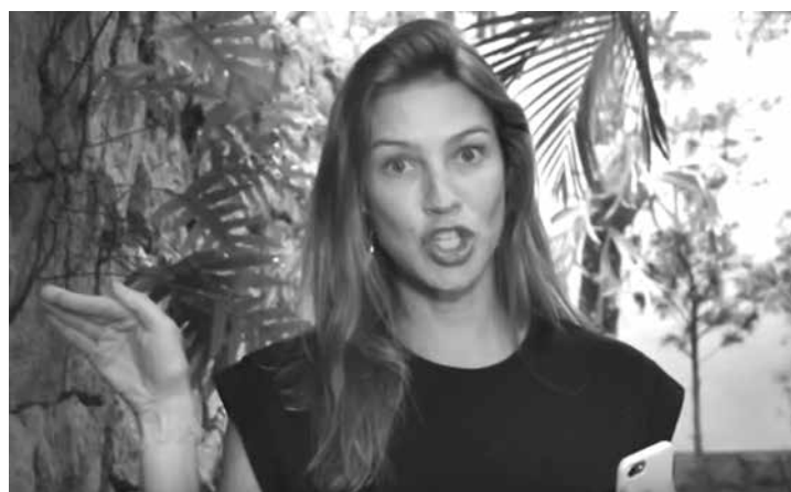
A atriz também desmentiu que tenha criticado a magreza da jornalista Patrícia Poeta

“A gente tem criatividade, aí você se safa. Porque se você não fizer o que eles querem, eles te mandam embora. Eu não queria ser mandada embora, então fiquei inventando coisas”, completou.