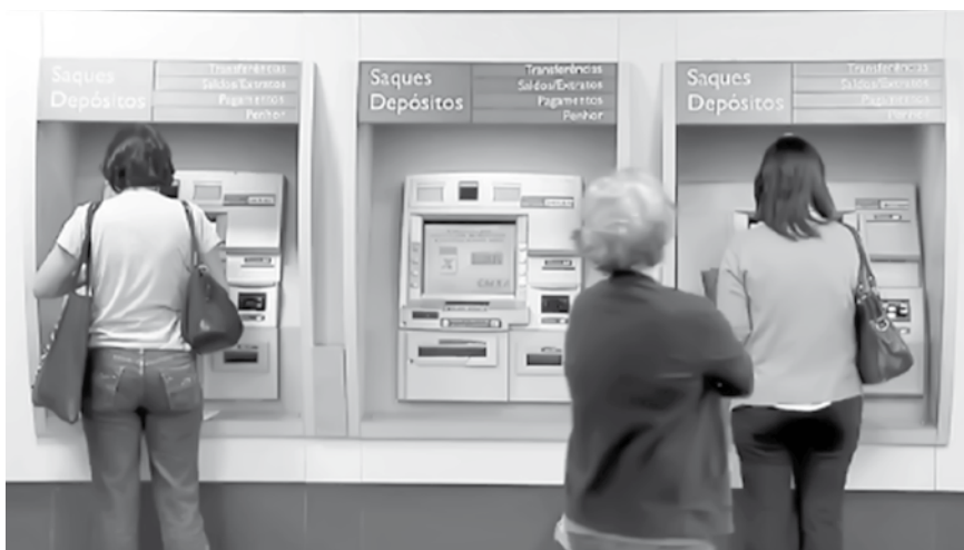
Prazo para saques do PIS/Pasep é dia 29 de junho

R$ 954, dependendo do tempo em que a pessoa trabalhou formalmente em 2016. Trabalhadores da iniciativa privada retiram o dinheiro na Caixa Econômica Federal, e os servidores públicos, no Banco do Brasil. É preciso apresentar um documento de identificação e o número do PIS/Pasep.