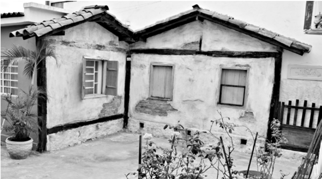
Fachada depois de pronta