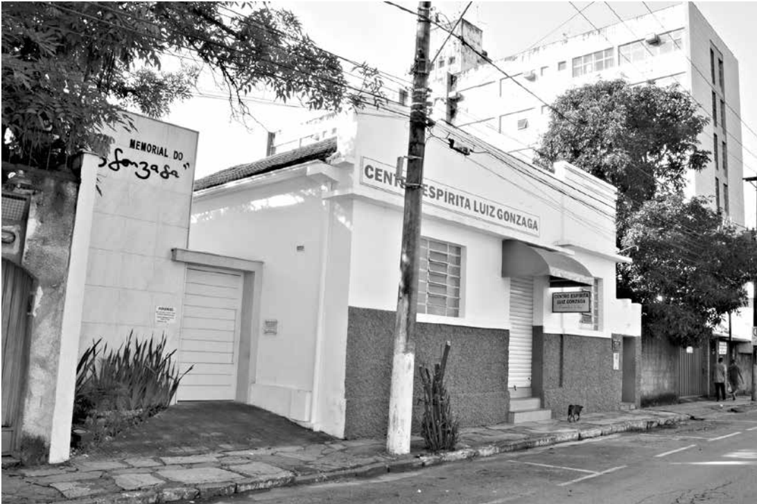
Fachada do Memorial do Luiz Gonzaga, atual Centro Espírita

Chico Xavier nasceu em uma casa com um pequeno porão, com batentes de madeiras. "As casas naquela época eram geminadas, pobres, humildes, com construções características do período e eu fui até a cidade mineira para reproduzir exatamente isso. Tive que localizar o madeiramento da época, as telhas de coxa de cem anos..."