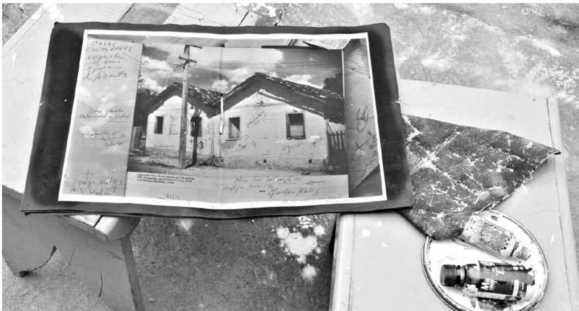
Flagrante de algumas anotações feitas antes de começar a realização da réplica

Ainda sobre seu trabalho, Granella finaliza com as seguintes palavras por ele escritas: "Que a modesta casa que abrigou Chico Xavier em seu nascimento e pobreza possa ser inapagável referencial de luz aos que buscam, com esforços da alma e das mãos, viver o Evangelho de Jesus; caminhos que o humilde datilógrafo e carteiro dos Espíritos jamais vacilou em trilhar e exemplificar, mesmo tendo espinhos sob os pés descalços. Da pequena casa dentro da Pedro Leopoldo de pouca extensão, lições de Imortalidade para todo o sempre!".