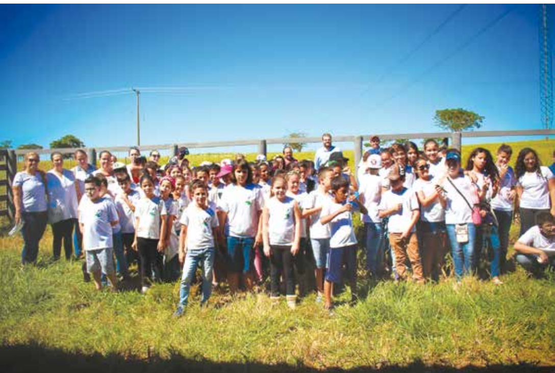
Ação foi realizada, em parceria, pela Prefeitura de Valentim Gentil, através da Secretaria de Educação e Cultura e do Departamento de Meio Ambiente