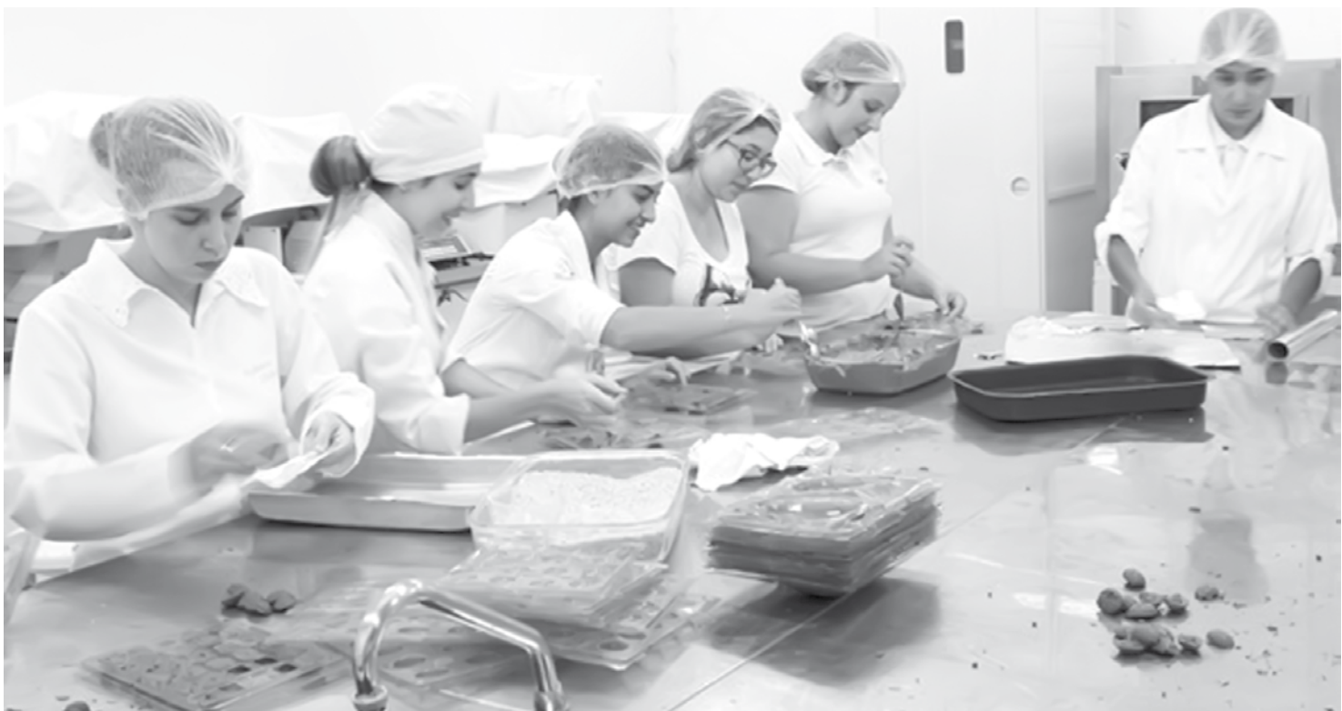
Projeto atende anualmente de 9 a 12 entidades do município

O objetivo do projeto, de âmbito municipal, é atender a população carente de Fernandópolis. "Hoje, temos pedidos de outras cidades, porém não temos condição de atendê-los, não somente pela questão financeira, mas devido à mão de obra, visto que a confecção dos ovos é feita pelos alunos do curso de Engenharia de Alimentos e outros cursos parceiros e, portanto, neste período, as atividades acadêmicas são pausadas por uma sema-