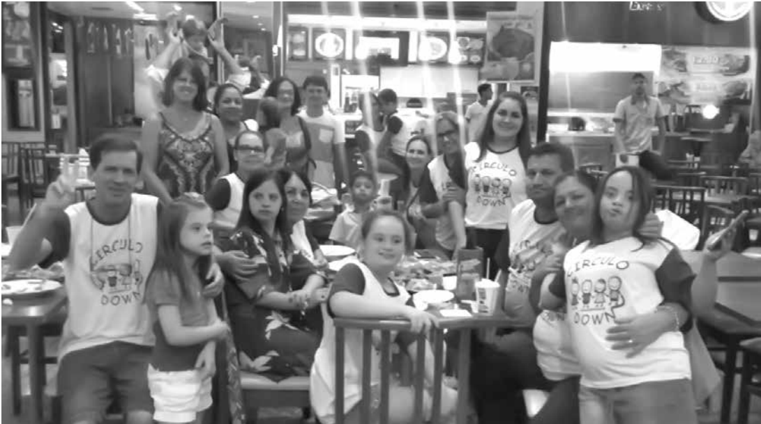
Pais de Fernandópolis e região se reuniram em encontro, realizado neste dia 21, para celebrar o Dia Internacional da Síndrome de Down.