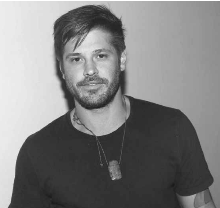
O ator deve ficar na cadeia, pelo menos, mais duas semanas