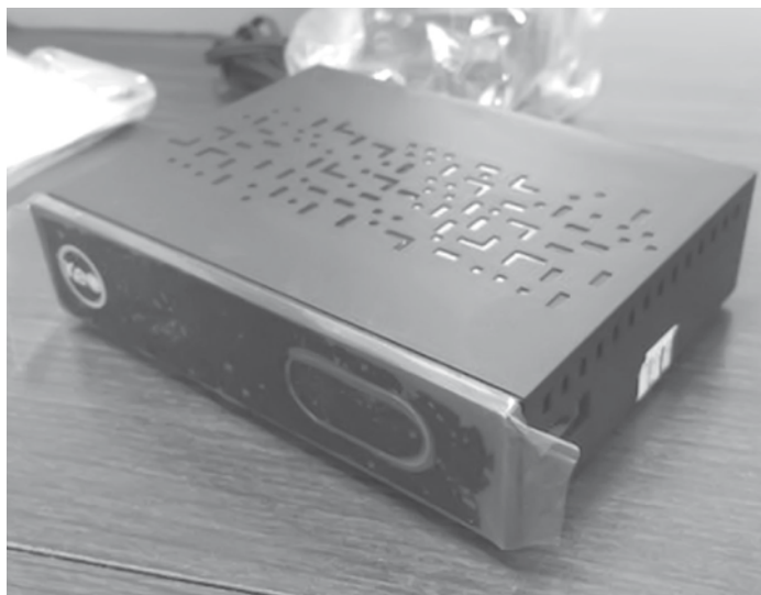
Para quem não quiser trocar de TV, o uso do conversor aumenta a qualidade de vídeo e áudio

outra já com o conversor integrado. A minha ainda está boa. Então optei pelo conversor e já notei a mudança na qualidade com imagem e som mais nítidos”, desta-