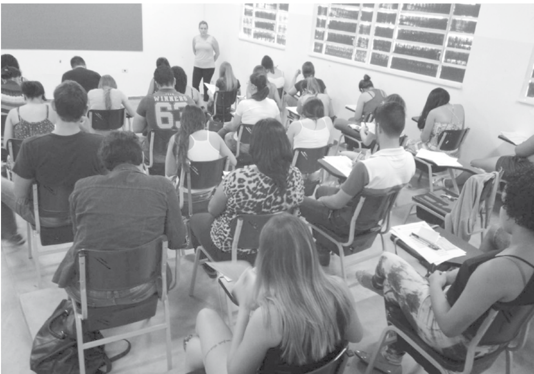
Prova começa às 9h, domingo, na FEF

Os candidatos deverão comparecer ao local da prova com antecedência mínima de 30 minutos, munidos do comprovante de inscrição, caneta azul ou preta, lápis e borracha e apresentar documento original com foto. O portão será fechado 10 minutos antes do horário estabelecido para início da prova. Os aprovados vão fazer parte de um cadastro de reserva para o possível surgimento de vagas durante o prazo de validade do processo seletivo e de acordo com o interesse da Administração Municipal. Vão fazer a prova estudantes dos cursos de Farmácia, Fisioterapia, Letras, Matemática, Odontologia, Pedagogia e Psicologia. Os contratados receberão bolsa no valor de R$ 954,00 para uma jornada de seis horas diárias. A prova objetiva será de caráter eliminatório e classificatório, sendo composta por 30 questões de múltipla escolha divididas entre as disciplinas de português, matemática e conhecimentos gerais/ atualidades. É importante destacar também que o processo seletivo para estagiários realizado no ano de 2017 teve seu prazo de validade prorrogado por mais um ano, portanto, os aprovados naquele certame ainda podem ser convocados ao longo de 2018.