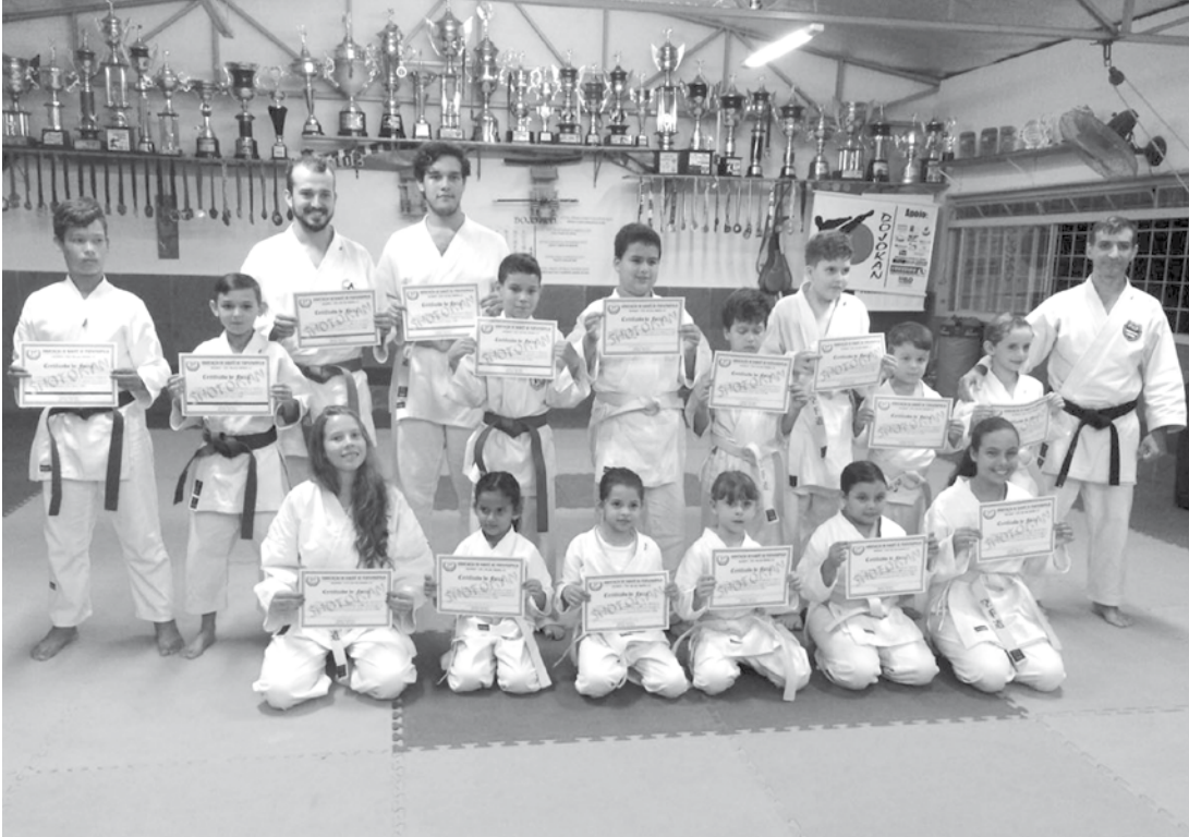
Atletas que treinam com apoio da Prefeitura têm primeiro desafio de 2018 agendado para o final de semana