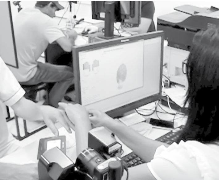
Biometria é obrigatória para 24 cidades no noroeste paulista

o cadastro está acabando, termina na terça-feira, dia 27. A maior cidade da região que está nessa lista é Catanduva, onde 14 mil eleitores ainda não procuraram o cartório eleitoral. O mutirão em Catanduva vai ser na central que está