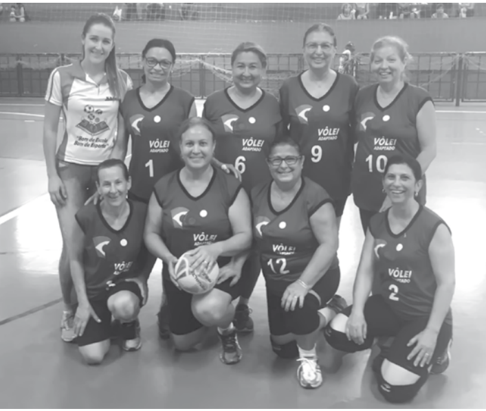
Aulas de vôlei garantem esporte e socialização das atletas