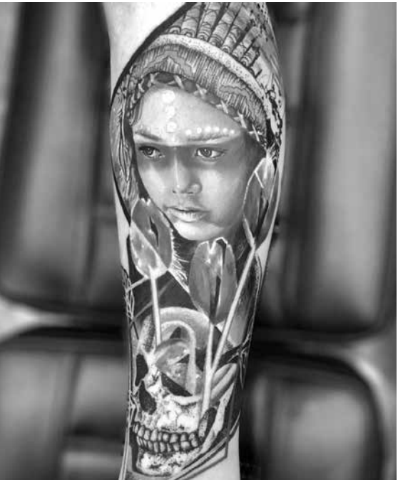
Tatuagem que deu o prêmio a Jhonny

Tatuador competiu na categoria Art Fusion Evolution e conquistou o prêmio de 1º lugar