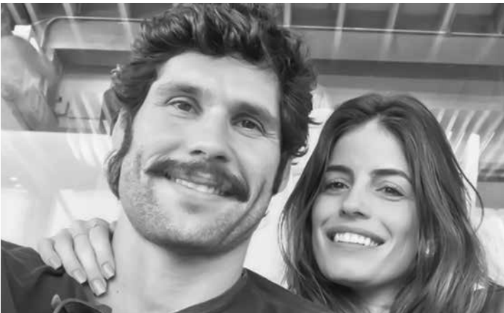
Ator é casado com sobrinha de Malu Mader

vinham planejando um filho desde que se casaram, em 2016. “Ser pai é o que mais quero. Amo crianças. Queremos muito e estamos nos organizando”, disse o ator em entrevista no início de fevereiro.