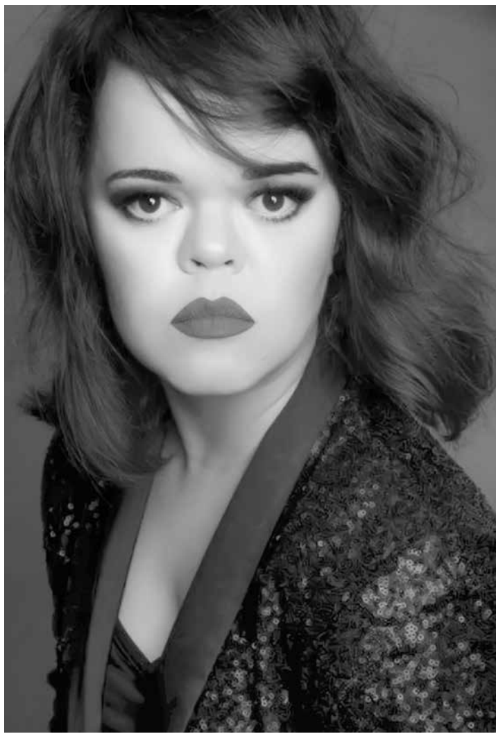
Atriz interpreta a Estela, de ‘O outro Lado do Paraíso’