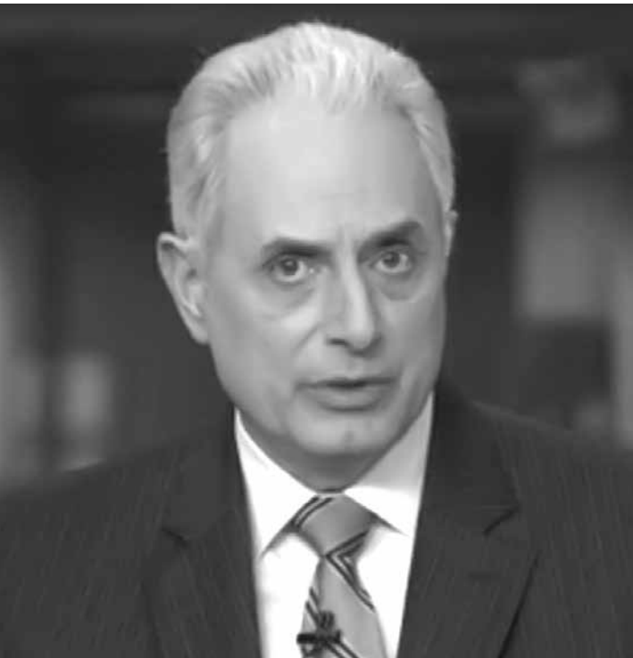
O jornalista rompeu com a emissora em dezembro do ano passado