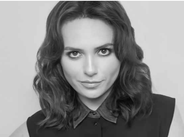
"Tenho certeza que assim que Temer, Aécio e Alckmim perderem o foro privilegiado, ele prende os três!", disse a atriz, de forma irônica

ta quinta-feira (5) pelo juiz Sérgio Moro, após decisão do Supremo Tribunal Fede-