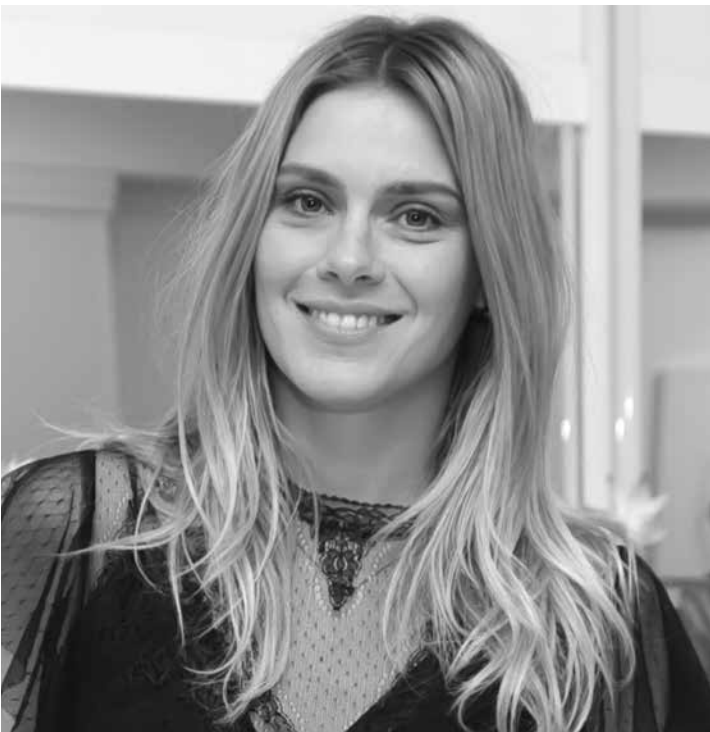
Carolina Dieckmann está morando em Miami