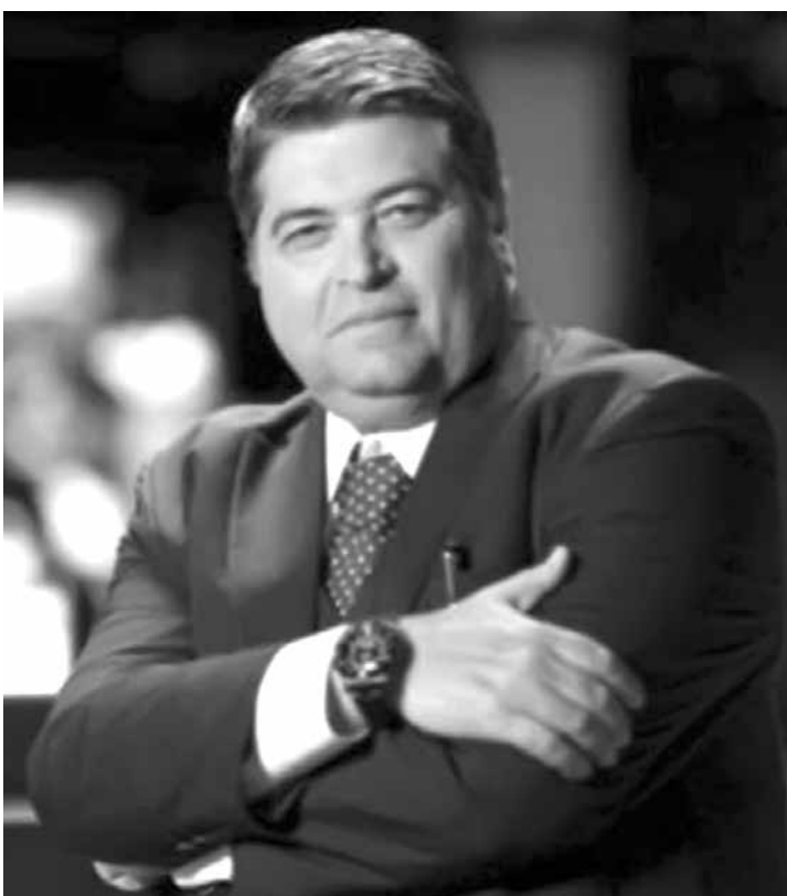
Apresentador passou mal na manhã desta quinta-feira nos bastidores da Band