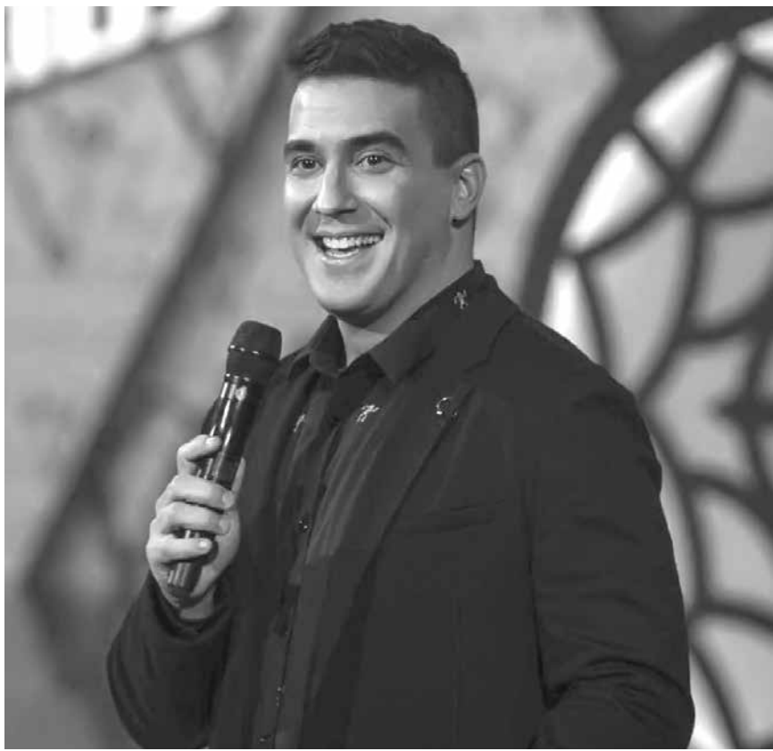
Apresentador se emocionou ao declarar que está há 25 anos na Globo

Antes, Simaria caiu no choro ao falar da experiência de julgar os participantes. “O artista muitas vezes tem o ego lá em cima, e que todos saibam que nesse programa não existiu nunca ego. As pessoas estavam preocupadas em dar a mão um pro outro, em dar amor. Todo mundo ia embora agradecido por ter conhecido pessoas incríveis aqui”.