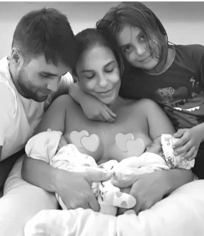
Ivete Sangalo e Daniel Cady comemoram dois meses do nascimento das filhas

Confirmada como uma das participações do Rock In Rio Lisboa após licença maternidade, Ivete Sangalo se apresentará no evento no dia 30 de junho. “A cantora promete levar para o Palco Mundo, o principal do even- to, um show especial!”, de- clarou um comunicado na rede social da artista. Mas vai ser em um festival LGBT em Morro de São Paulo, na Bahia, que marca sua vol- ta aos palcos no dia 19 de maio, no San Island We- ekend. Enquanto isso, a morena tem se preparado fisicamente retomando os exercícios e sem abrir mão dos cuidados das herdeiras: “Estou amamentando as du- as ao mesmo tempo. Nas primeiras noites, a adapta- ção é mais difícil, mas já se apegaram. E eu tenho muito leite, graças a Deus. Está tudo ótimo. As meninas são lindas. São quietas. Minhas pequenas são saudáveis e muito gulosas”, disse.