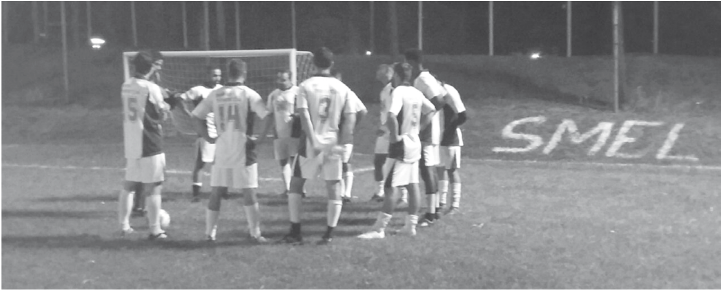
Santa Casa x Malharia Silva/Sete Center jogam pela vaga na final na quinta-feira, 19

entre os quatro primeiro colocados. Nas partidas disputadas no dia 12, o time Santa Casa venceu o Deaço por 5 a 2; já a Malharia Silva/Sete Center ficou com a vaga na semifinal após ganhar da Cofo Agro por 3 a 0. Santa Casa x Malharia Silva/Sete Center jogam no dia 19 de abril, às 19h30.