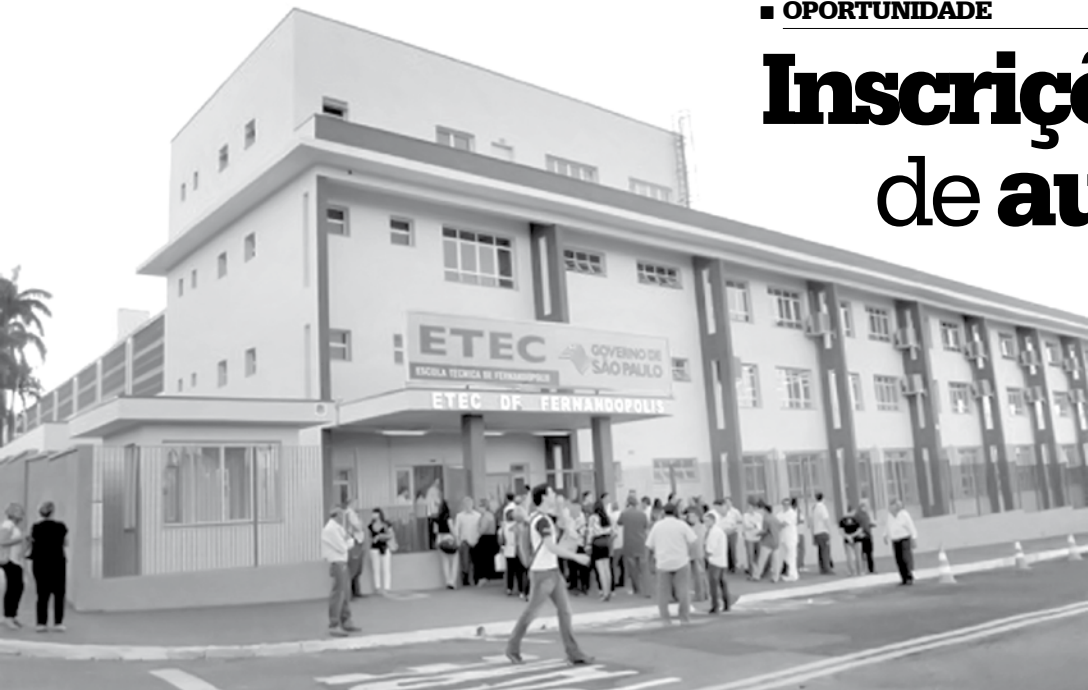
Vagas são direcionadas aos profissionais da área da informática