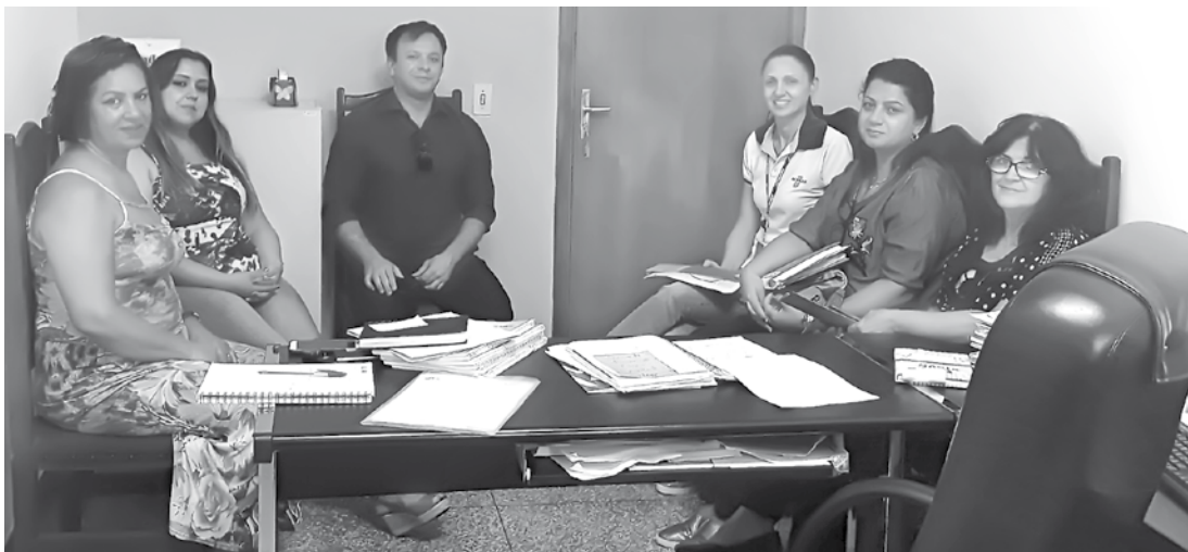
Objetivo do programa é estimular a cultura do empreendedorismo nas instituições de ensino da rede pública

4ºano “Locadora de Produtos”, 5ºano “Sabores e cores”, 6º “Ecopapelaria”. Conforme cada tema apresentado os estudantes darão início aos projetos, e lucram com a venda deles em feira exposta a comunidade.