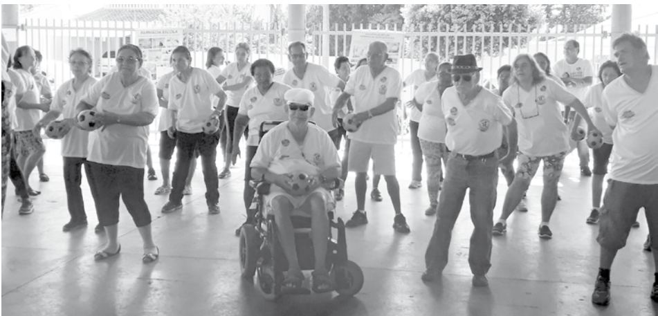
Profissionais ficaram disponíveis em vários stands distribuídos pela feira