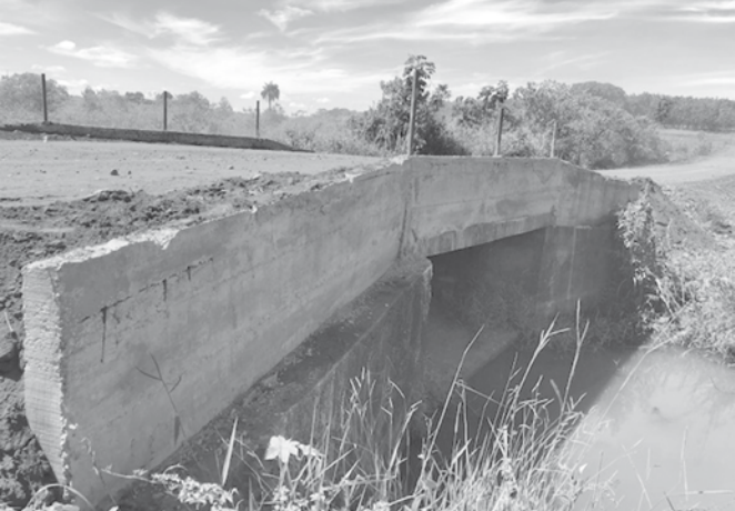
Além da ampliação, foi também reforçada toda a estrutura da ponte