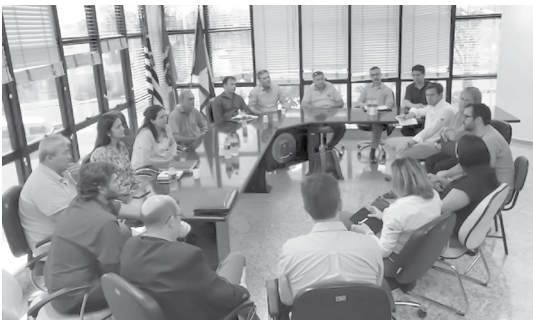
Reunião objetivou acertar os últimos detalhes do empreendimento

MWac). A construção do projeto faz parte do plano da AES Tietê de obter cerca de 50% do Ebitda de geração “não-térmica” até 2020. A obra encontra-se em fase de terraplanagem. A empresa disse que espera que o empreendimento se beneficie de sinergias com a obra de outro projeto em seu portfólio, o Complexo Solar Boa Hora, bem como pelo “aproveitamento da capacidade global da The AES Corporation para a compra de placas solares e equipamentos periféricos”.