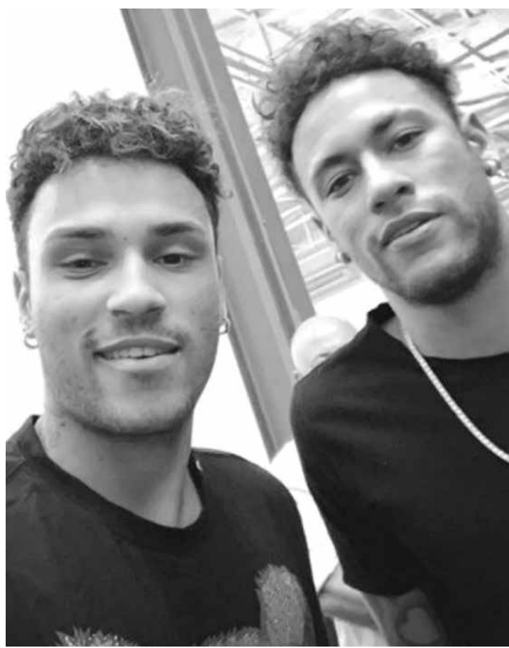
Cover de Neymar posa ao lado do craque