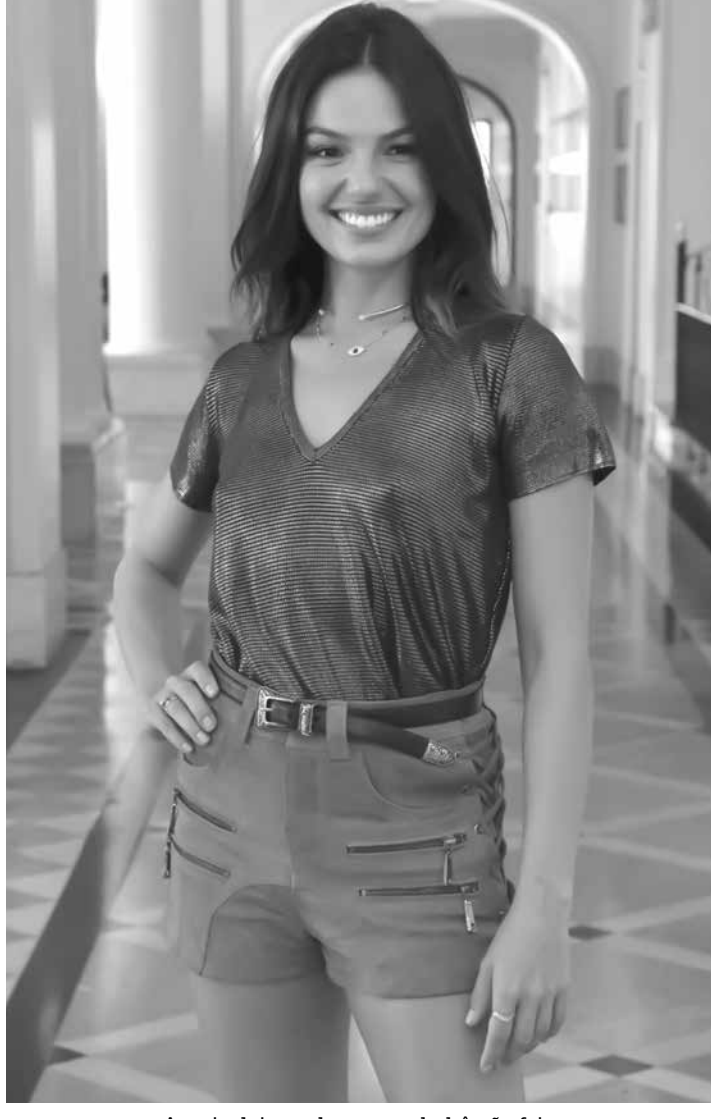
A atriz deixou claro que o bebê não foi o motivo para reatar seu relacionamento

bê foi o motivo para reatar o relacionamento com o namorado, com quem ficou brevemente separada no final de 2017: “Em dezembro nos separamos por um breve período. Mas sofremos muito com isso, afinal, nos amamos e sempre desejamos construir algo maior! Não aguentamos a saudade e retomamos nossa história, decidindo que moraríamos juntos e que deixaríamos a porta aberta para que Deus nos presenteasse com um filho. Isso seria um sonho realizado. Levamos isso adiante até o convite de uma novela chegar. Mas, para a nossa surpresa, Deus mandou nosso pacotinho. Estamos radiantes e gratos por tudo que estamos construindo. Nossa família agradece todo o carinho vindo de vocês”.