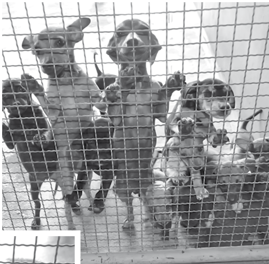
Pessoas interessadas na adoção devem procurar o CCZ

Muitos cachorros e gatos que estão pra adoção foram abandonados pelos seus antigos donos e no CCZ receberam toda assistência e cuidados. Os animais adultos são entregues às novas famílias já castrados. Quando a procura é por filhotes, eles ficam com a castração agendada, para quando tiver a idade suficiente seja realizado o procedimento, o que ocorre a partir do quinto mês de vi-