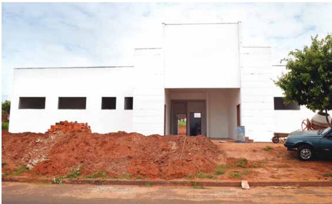
Construtora faz no momento os serviços de pintura e colocação de esquadrias

sendo R$ 408 mil de convênio firmado com o Ministério da Saúde e R$ 53 mil de contrapartida do município, esta unidade de saúde terá 275 metros quadrados de construção, com quatro consultórios, sendo um odontológico, e salas de curativo, vacina, inalação e observações, além de almoxarifado e recepção.