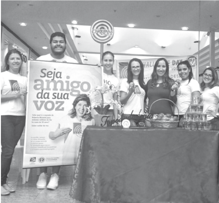
Alunos do curso de Fonoaudiologia aderiram a campanha nacional de lema “Seja Amigo da sua Voz”