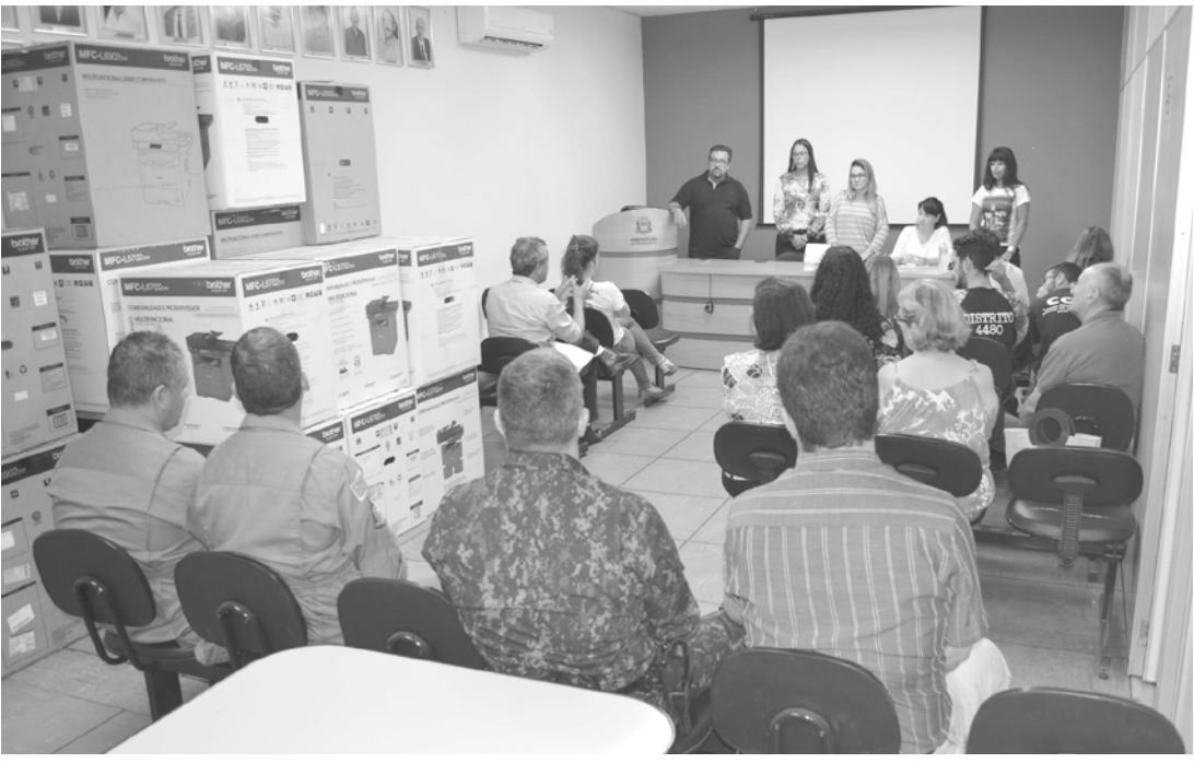
Reunião com colaboradores aconteceu na tarde desta segunda-feira

riou 11 toneladas. Todas as doações serão repassadas à população através das entidades, associações de bairros, CRAS (Centro de Referência de Assistência Social) e do CREAS (Centro de Referência Especializado de Assistência Social). Para participar desse projeto de solidariedade, basta fazer a doação em um dos postos de coleta, que estarão disponíveis a partir do dia 1º de maio: Prefeitura, Escolas, Clubes de Serviços, Polícias, Secretarias Municipais, Tiro de Guerra e Shopping Center. Durante a campanha também serão realizados dois arrastões, nos dias 05 e 12 de maio, das 08h às 12h. Os voluntários, identificados, passarão por todos os bairros da cidade para fazer a coleta dos doativos.