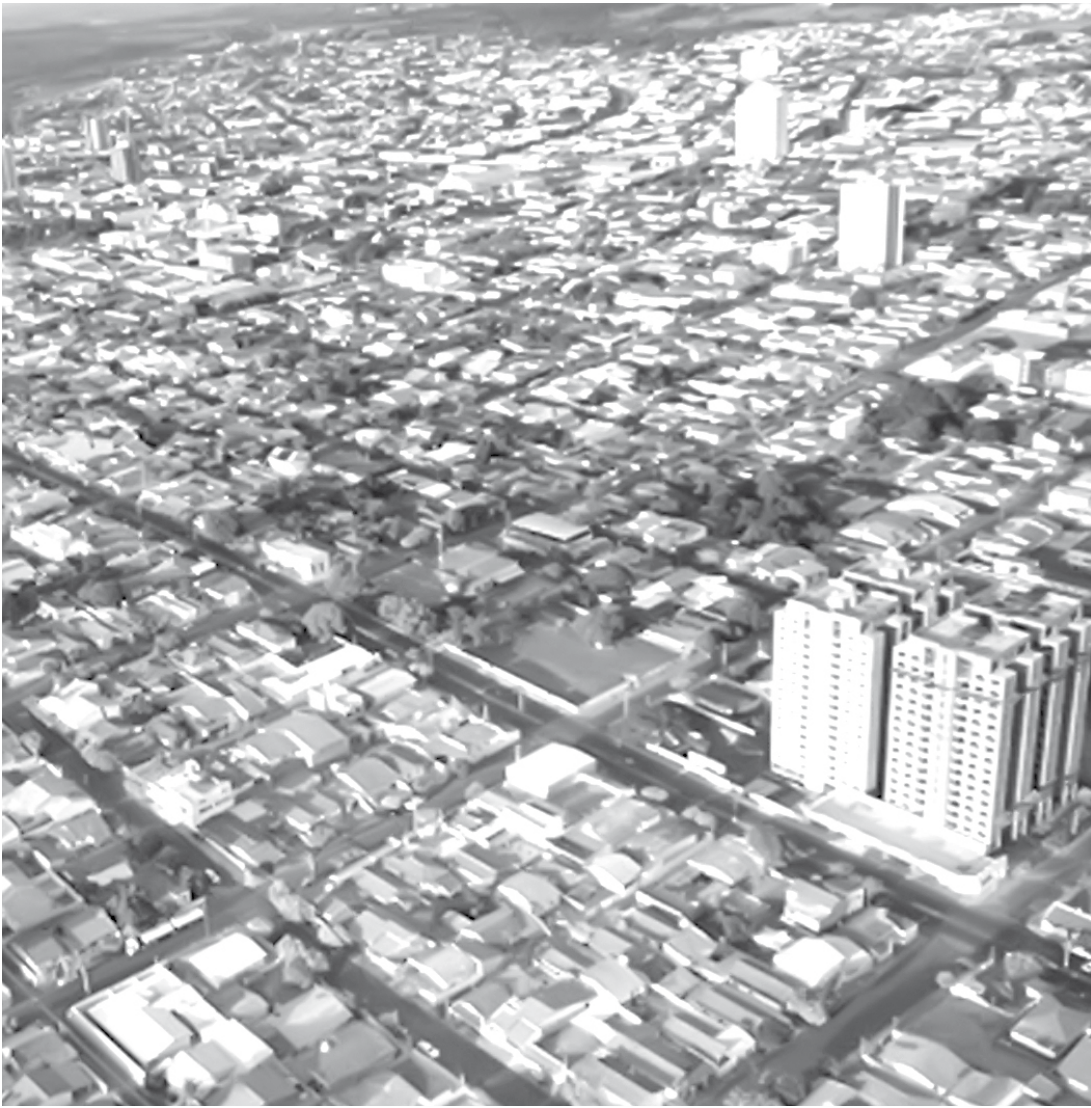
Recursos são repassados por meio da Secretaria da Fazenda do Estado de São Paulo

Os repasses aos municípios são liberados de acordo com os respectivos Índices de Participação dos