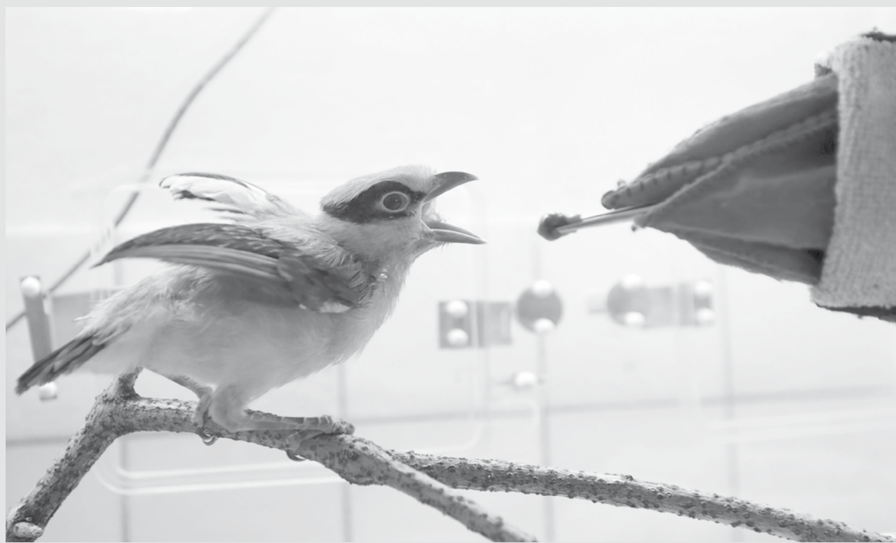
imagem do dia

Um cuidador utiliza um boneco de luva imitando um pai para alimentar um Cissa thalassina, espécie de ave criticamente ameaçada em um zoológico em Praga, na República Tcheca.