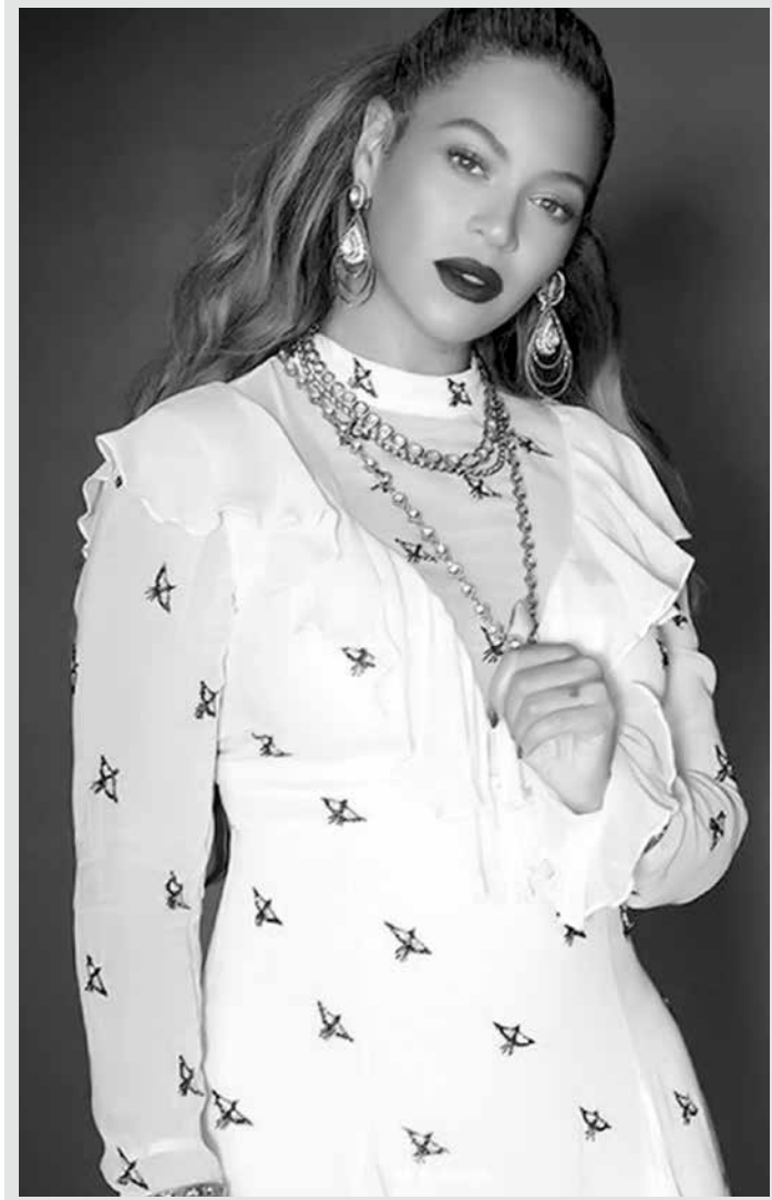
Dinheiro será doado para quatro instituições de ensino.

das foram a Universidade de Tuskegee, a Universidade de Bethune-Cookman, a Universidade Xavier de Louisiana e a Universidade de Wilberforce. O show da cantora no Coachella foi amplamente elogiado pela crítica. Beyoncé homenageou as bandas de música, os grupos de dança e de “passinho” de universidades historicamente negras. Ano passado, a cantora lançou o Formation Scholars Awards Program, um programa de bolsas de estudo para apoiar jovens mulheres criativas e ousadas, como forma de comemorar um ano de lançamento do álbum “Lemonade”.