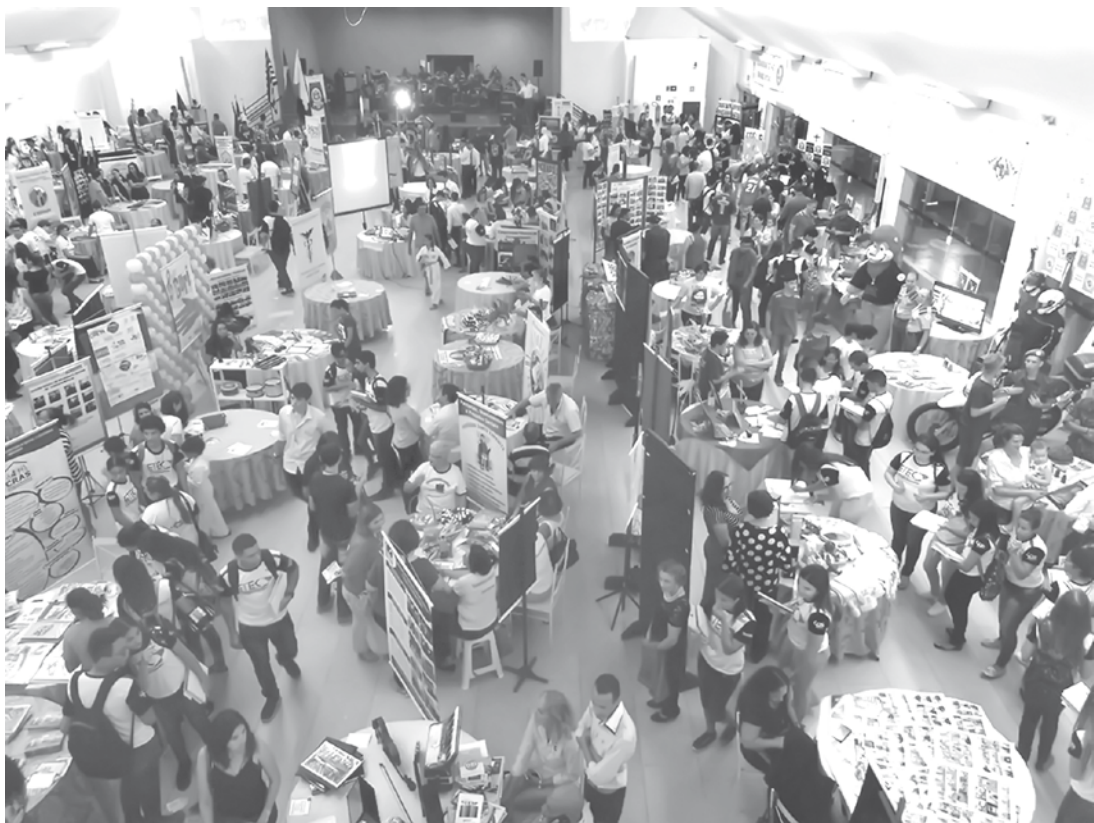
Edição deste ano reuniu cerca de 100 entidades de Fernandópolis e região

franca. Os moradores de Fernandópolis e região puderam prestigiar apresentações do Grupo Musical Os Sonhadores, Maestro Tito e Orquestra de Violeiros, Palhaços de Plantão, Coral Municipal, entre outras atrações. Considerado como um Congresso de Entidades filantrópicas da região, o evento atraiu nesta 3ª edição cerca de 100 entidades, instituições e órgãos expositores. Em nota, a Associação de Amigos do Município de Fernandópolis - AAMFER, comentou sobre o evento: