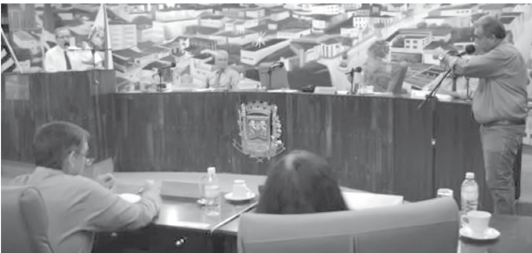
Sessão aconteceu na terça-feira, 17

Além das mudanças nas gratificações por Comissão, na mesma Sessão foi votado o fim da gratificação salarial por diploma universitário. A mudança, que previa o término da bonificação para contratados a partir da promulgação da Lei, feria o princípio