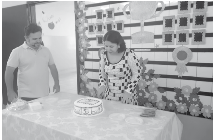
Bolo, diversão e homenagens marcaram comemoração na escola

Além do papel educacional, nossa instituição de ensino tem como proposta ser forma-