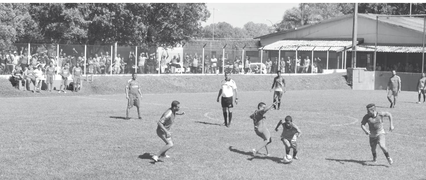
Santa Casa X Malharia Silva/Sete Center; e Engerb X Prefeitura SME disputam vagas na final