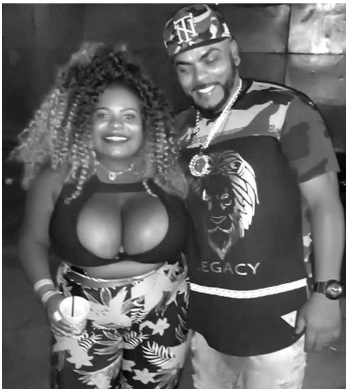
Os dois se conheceram no segundo semestre de 2017

“Tenho o meu boyzinho, mas tem coisas que precisam ser mantidas na reserva. No dia em que formos flagrados por um paparazzo, tudo bem, mas até lá prefiro não expor”, disse Jojo, acrescentando: “É com ele que eu vou casar. Tem pessoas que a gente escolhe para ser o pai dos nossos filhos. É o caso dele. Sempre gostei de me envolver com pessoas mais velhas para que eu possa aprender com elas”.