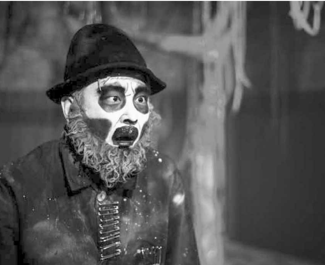
Peça tem diversas influências que vão da Polônia ao Japão