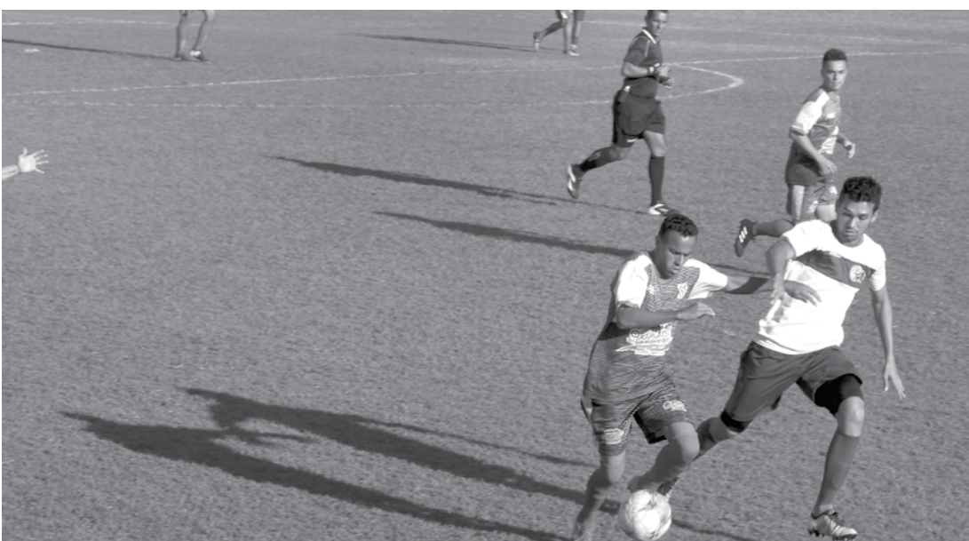
Lance do primeiro jogo da final