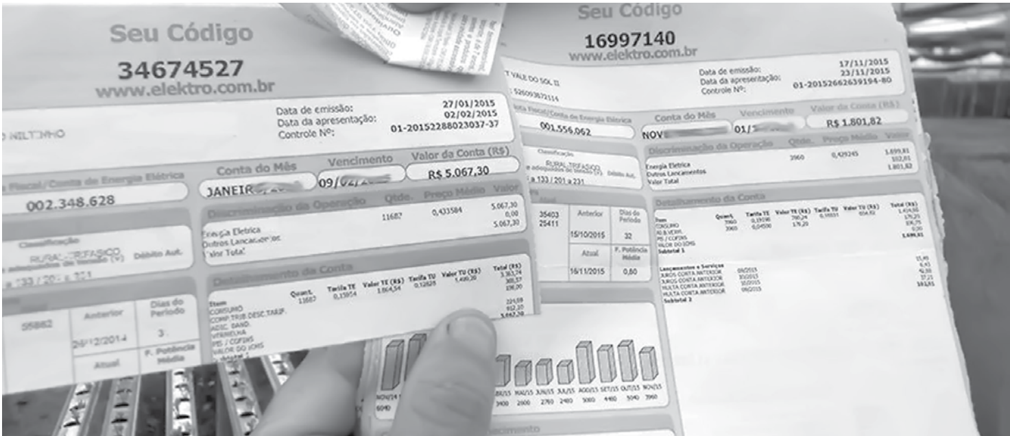
Conta de luz será na bandeira amarela para o mês de maio

Com a adoção da bandeira amarela, a Aneel aconselha os consumidores a adotar hábitos que contribuam para a economia de energia, como tomar banhos mais curtos utilizando o chuveiro elétrico, não deixar a porta da geladeira aberta e não deixar portas e janelas abertas em ambientes com ar-condicionado, entre outros.