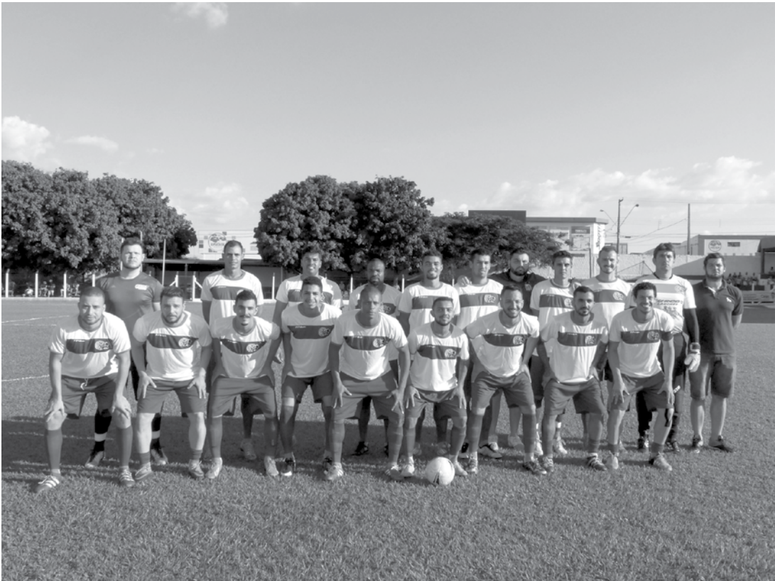
Equipes prometem realizar uma final muito disputada no estádio Antônio Sergio Buosi, em Fernandópolis