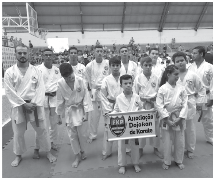
As provas serão disputadas a partir das 8h

A etapa estadual é classificatória para o campeonato brasileiro de Karatê. Conforme o regulamento, os dois primeiros colocados de cada categoria, ganham vaga para a próxima fase.