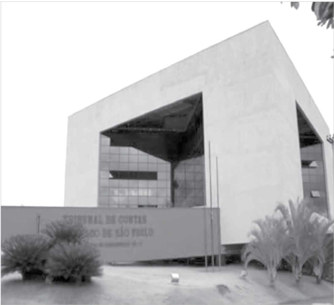
Na região são 43 Prefeituras abrangidas e 180 órgãos públicos fiscalizados pela equipe do TCE

O programa de fiscalização concomitante foi implantado em 2014. Por ser sede de Unidade do Tribunal de Contas, Fernandópolis tem suas contas subordinadas a Unidade de São José do Rio Preto. As contas de Rio Preto são analisadas por Fernandópolis. Serão alvo da “fiscalização concomitante” os seguintes municípios subordinados a UR 11 de Fernandópolis: Álvares Florence, Américo de Campos, Aparecida d’Oeste, Dirce Reis, Estrela d’Oeste, Guarani d’Oeste, Indiaporã, Jales, Marinópolis, Meridiano, Mira Estrela, Palmeira d’Oeste, Paranapuã, Parisi, Pedranópolis, Pontalinda, Populina, Rubinéia, Santa Fé do Sul, São Francisco, São João das Duas Pontes, São José do Rio Preto, Turmalina, Urânia e Votuporanga.