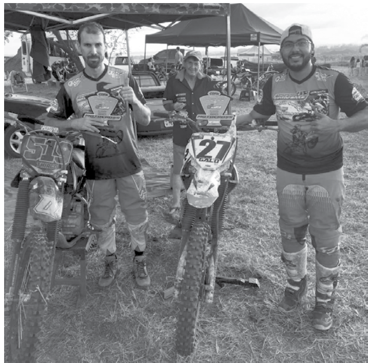
Evento aconteceu no último final de semana