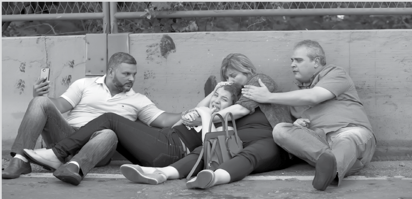
Um intenso tiroteio foi registrado na Zona Oeste do Rio de Janeiro, na manhã desta quinta-feira, 03. Desesperados, motoristas e passageiros saíram dos carros e se esconderam dos tiros atrás de uma mureta.