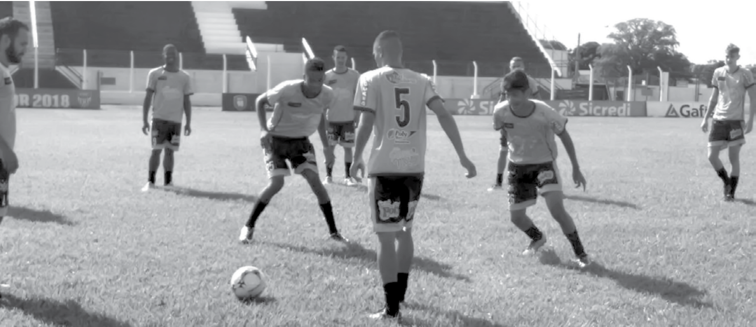
Equipe pode alcançar liderança do Grupo 2