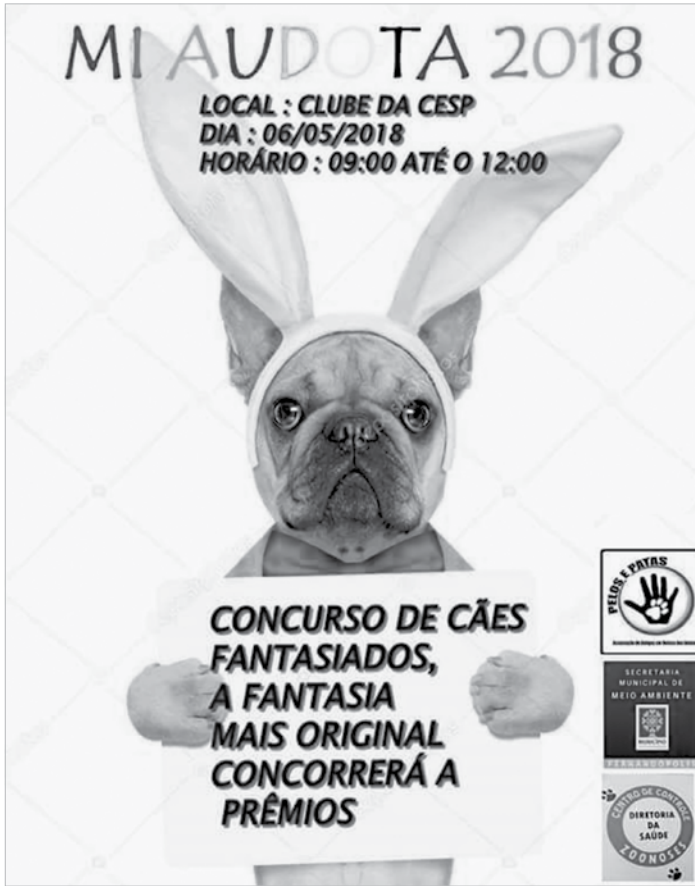
Evento será das 9h às 12h

O Centro de Controle de Zoonoses tem atualmente cerca de 100 animais disponíveis para adoção e a espera de um novo lar. Para participar do ‘1º Mi Audota’, basta que a pessoa interessada faça um cadastro, munida de documentos pessoais e assine o termo de posse responsável, dispon-