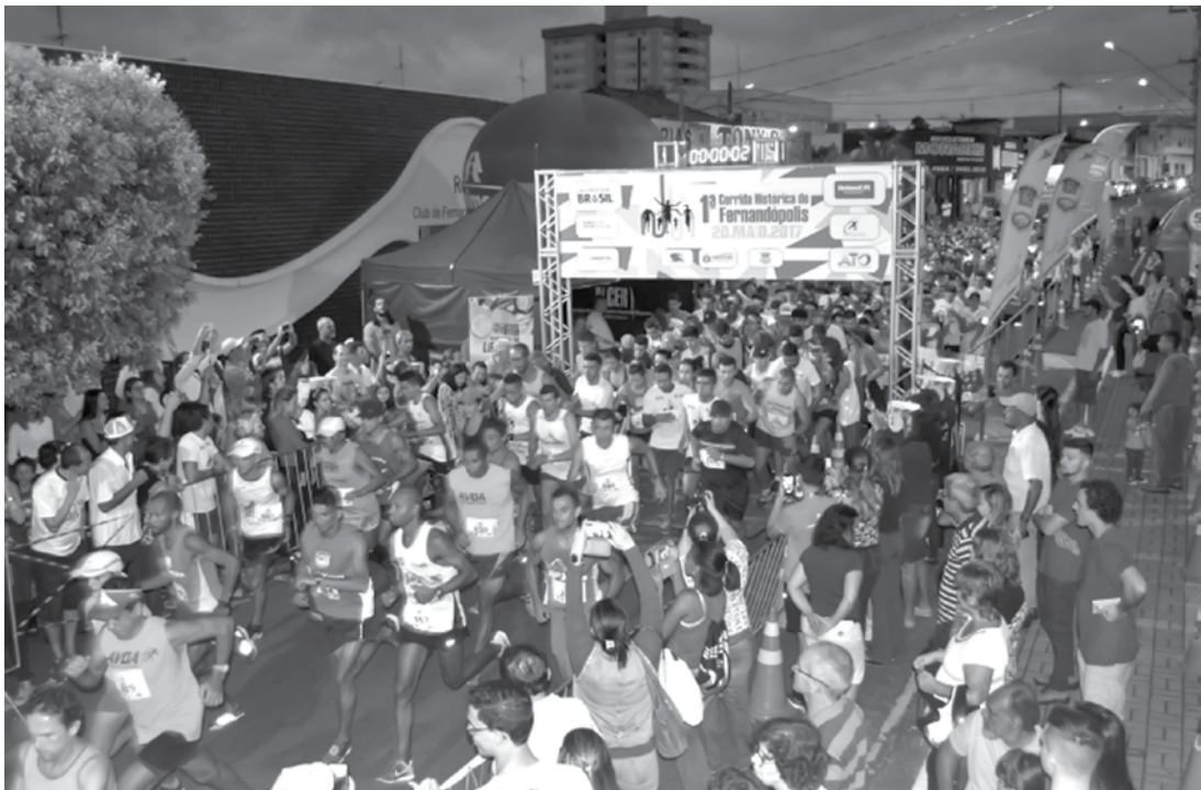
Evento faz parte do calendário comemorativo aos 79 anos do município

A previsão é que a corrida, realizada pela Prefeitura de Fernandópolis, por meio da Secretaria Municipal de Esportes e Lazer, com apoio da Afercan (Associação Fernandopolense de Ciclismo, Atletismo e Natação), reúna cerca de 500 atletas, de diversas regiões do país.