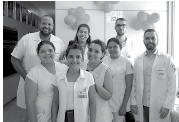
Alunos visitaram o Hospital de Câncer e a Santa Casa de Fernandópolis

rios sobre esse mal que atinge aproximadamente 25% da população brasileira.