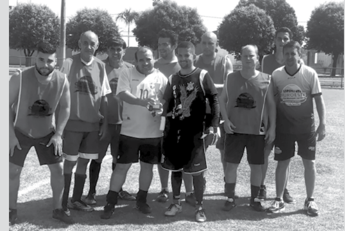
Equipe de vermelho recebeu o troféu de vice-campeã do Vereador Rosalino