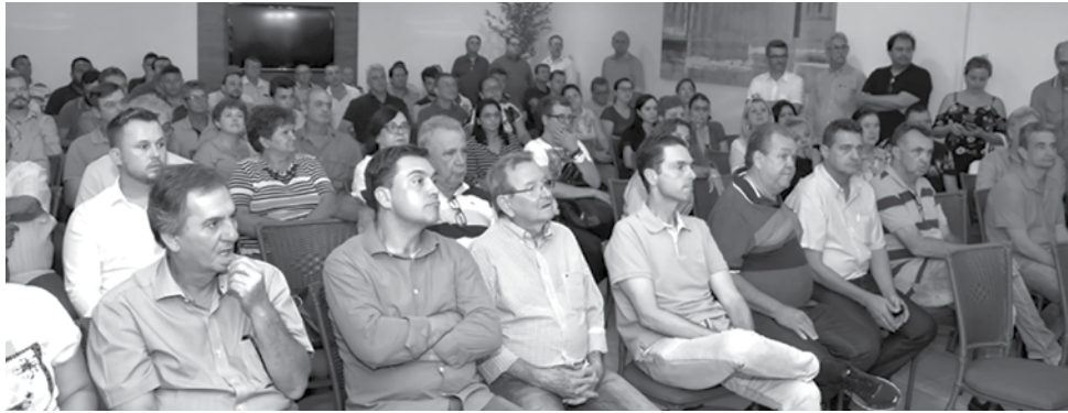
Objetivo da reunião foi debater o fortalecimento de parcerias para que os dois parlamentares tenham uma base de sustentação rumo às eleições deste ano

a liderança, buscar mais recursos e benefícios para todas as cidades da região Noroeste”.