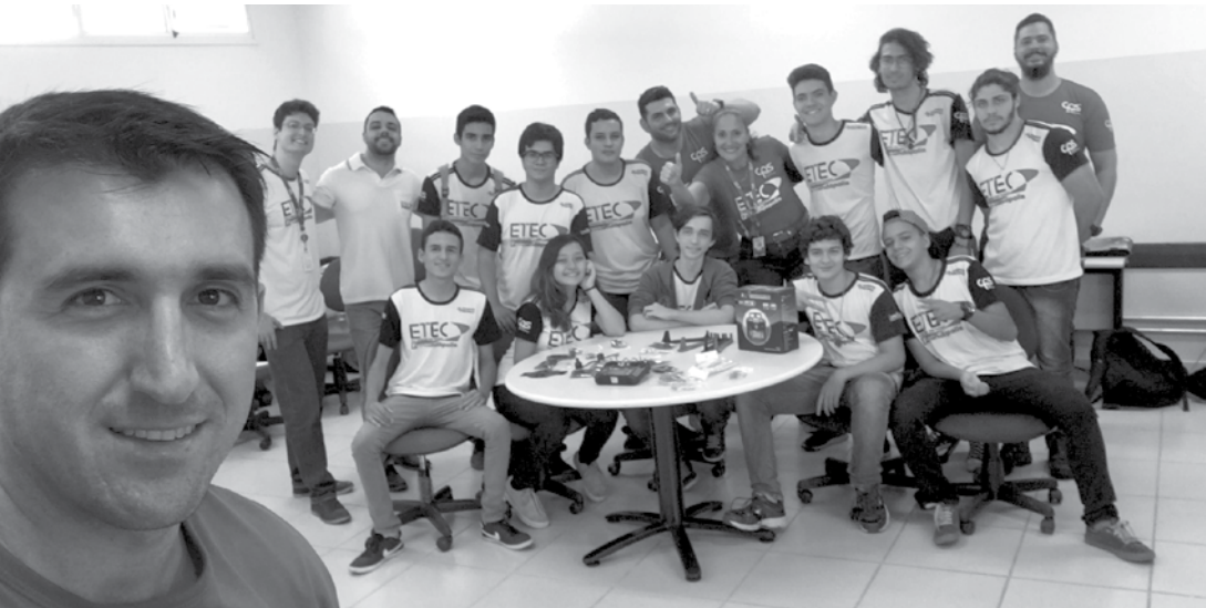
Competição será realizada na cidade mineira de Itajubá