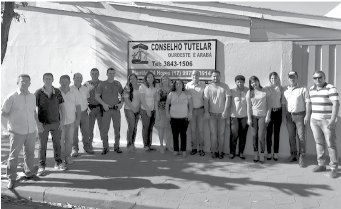
Para comemorar os serviços de melhoria das instalações do conselho, a administração promoveu uma reinauguração que contou com várias autoridades