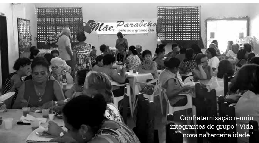
Confraternização reuniu integrantes do grupo “Vida nova na terceira idade”