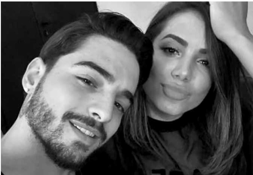
Tanto ele quanto ela são as últimas pessoas a serem seguidas em seus perfis.

À publicação, ela se afirmou favorável a legalização do aborto, posição defendida por outras celebridades, como Monica Iozzi. “As ricas quando têm uma gravidez indesejada abortam com segurança, enquanto as pobres morrem em lugares clandestinos. Isso é ser a favor da vida?”, questiona Nathália. Ativa nas redes sociais, ela contou ainda como lida com os comentários negativos diante de postagens na qual se posiciona diante de tais questões. “Deixei de ter tanto medo de dar a cara a tapa. Por outro lado, brigo menos”, afirmou.