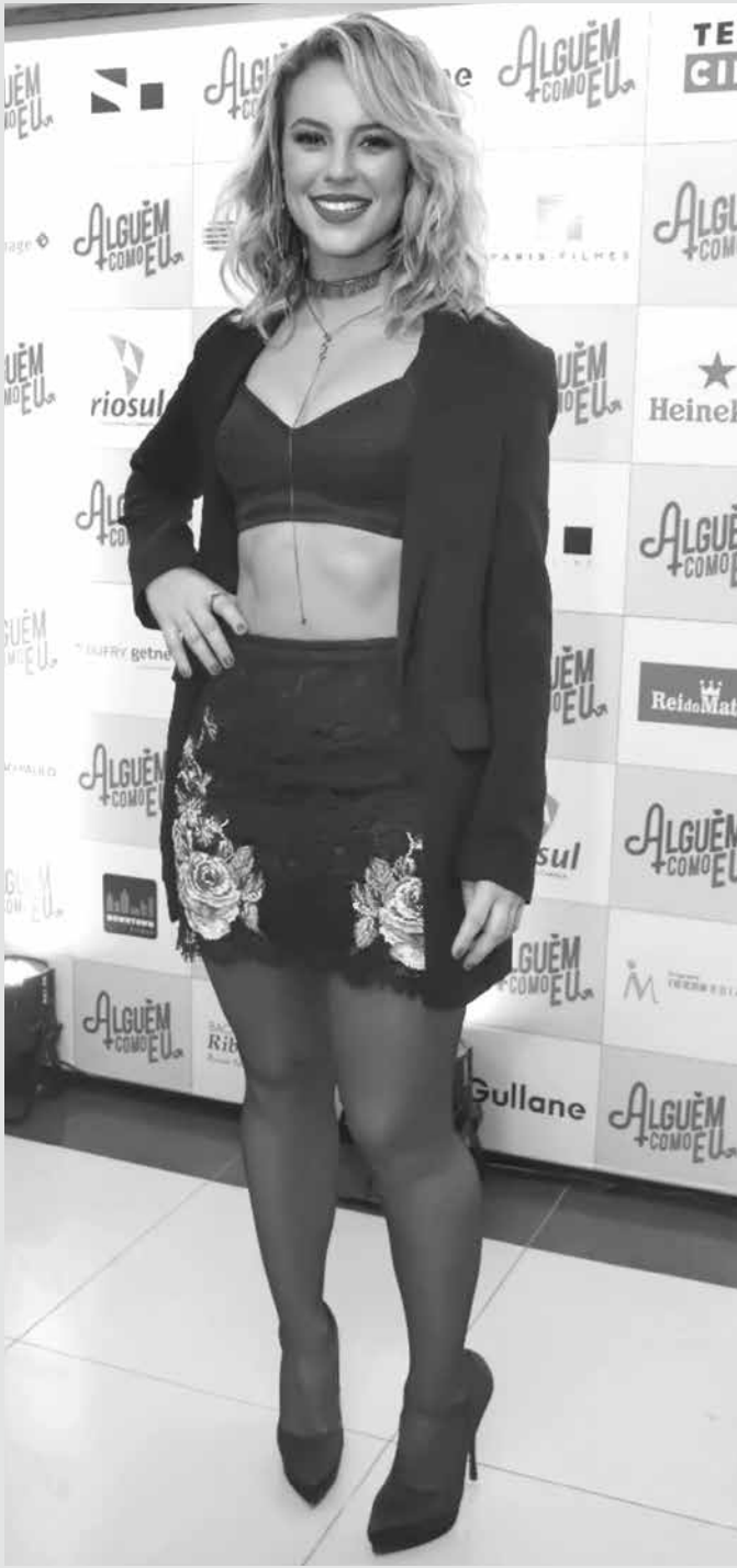
Atriz lançou o filme 'Alguém Como Eu', no Rio, nesta segunda-feira (14)