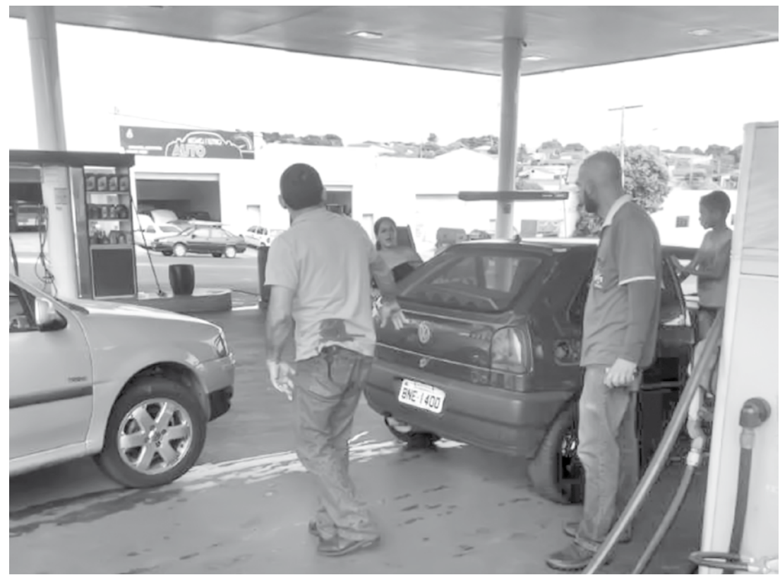
Homem apareceu baleado no Posto Brasil

Em nota divulgada à imprensa na tarde de ontem, a Polícia Militar esclareceu que o Soldado PM que realizou o disparo pertence a um Batalhão do município de São Paulo, foi autor de um disparo após uma discussão no trânsito. A vítima é, também, um po-