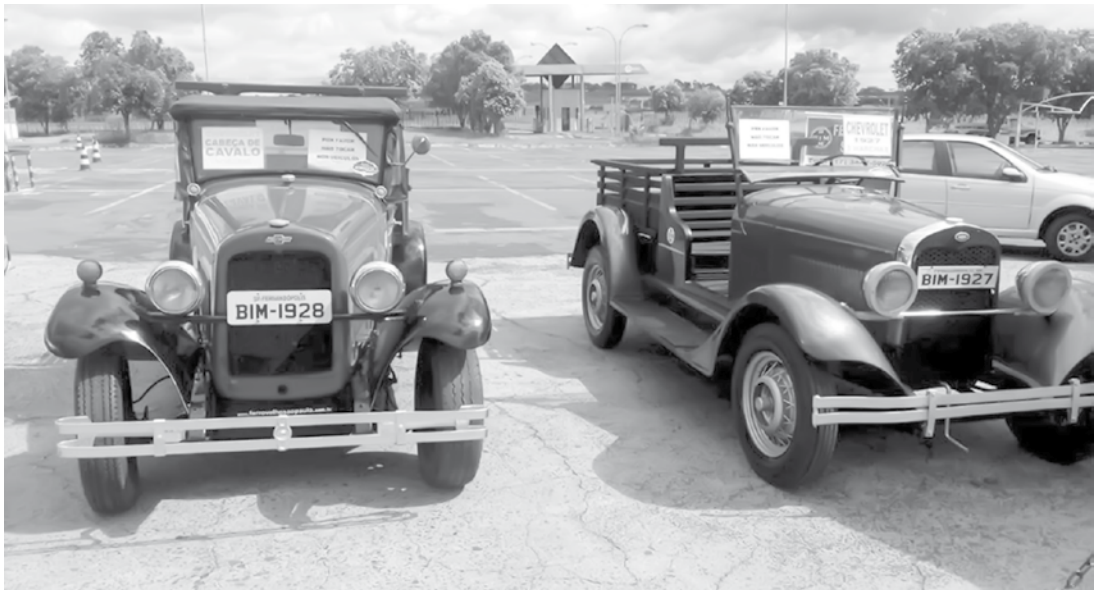
Evento é beneficente e faz parte do calendário comemorativo aos 79 anos de Fernandópolis

Os carros são dos anos de 1930 até 1990, com presença confirmada do exótico Mustang Sherby. Como ingresso, o público pode colaborar com a doação de um quilo de alimento não perecível ou um litro de leite ou um pacote de fralda geriá-