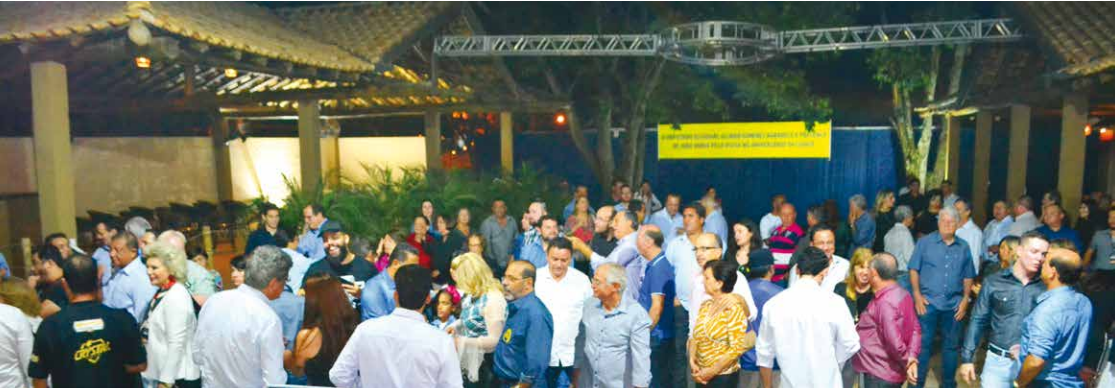
Público presente no Rancho da Expo Fernandópolis durante recepção a Dória