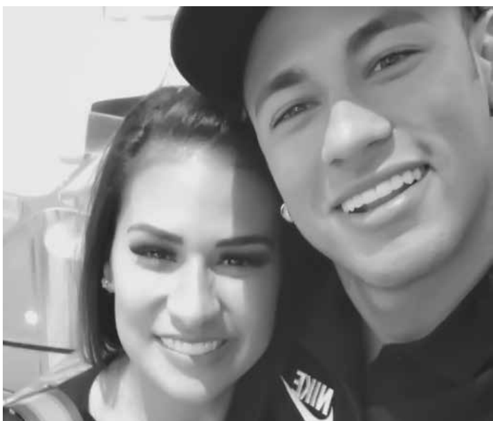
A irmã de Simaria está de férias na França com a família e acompanhou um treino do Paris Saint-Germain

“Obrigada, amigo, pelo convite. É um menino de ouro, bacana, coração bom. Pense em um menino abençoado! Massa”, disse Simone sobre o jogador.