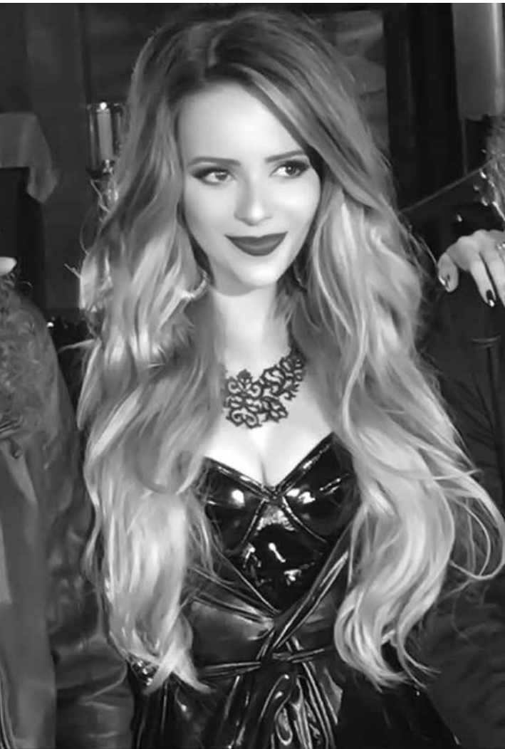
A cantora colocou aplique somente para gravar o clipe