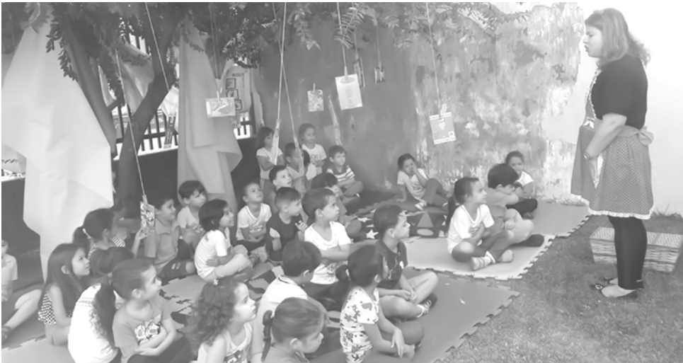
“Contação de Histórias” para crianças de 4 a 5 anos, que aconteceu no Museu

No Museu Água Vermelha, em Ouroeste, haverá uma programação especial até dia 24 de maio. Na última segunda-feira, dia 14, houve oficina de cerâmica primitiva. Nos dias 15, 17 e 18 acontecerá “Contação de Histórias” para crianças de 4 a 5 anos. No dia 16 de maio das 14h às 16h haverá ação educativa para idosos, onde serão instruídos por um professor sobre como