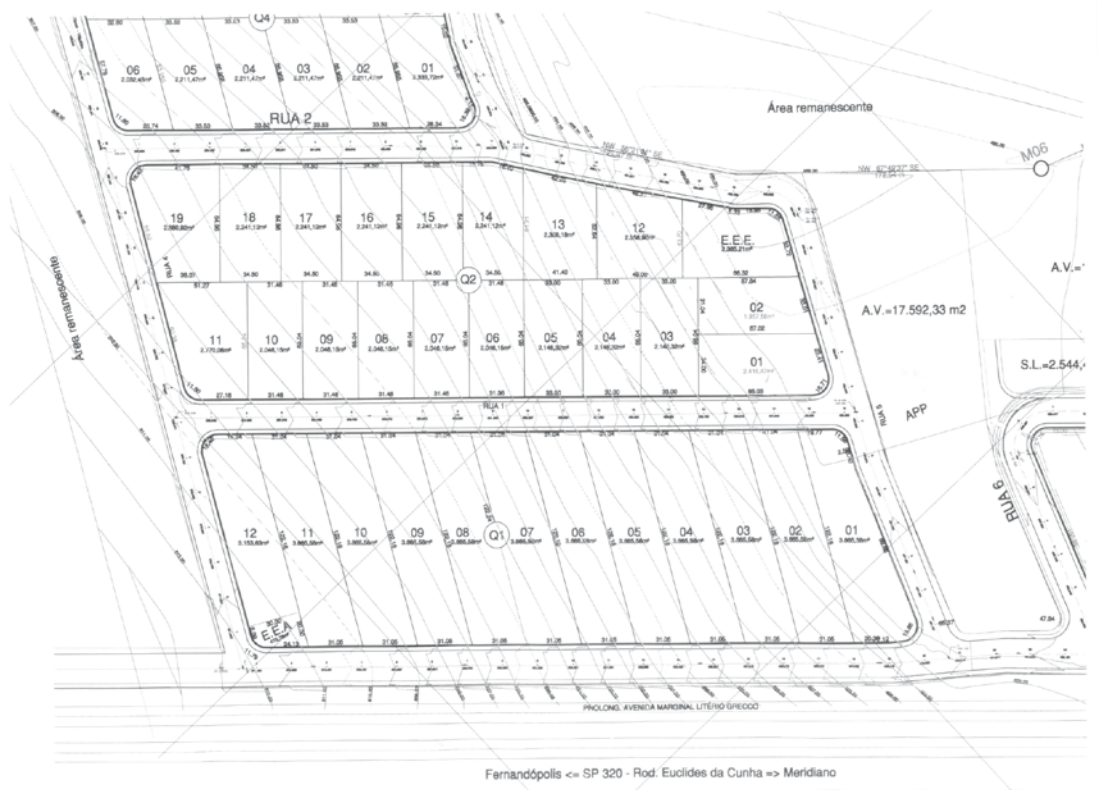
Planta da área de construção da primeira etapa do Distrito Empresarial VI

A luta para conquista do MIT foi árdua. Foi necessário dedicação total, diversas noites de trabalho e uma equipe totalmente focada para que o projeto fosse apresentado a