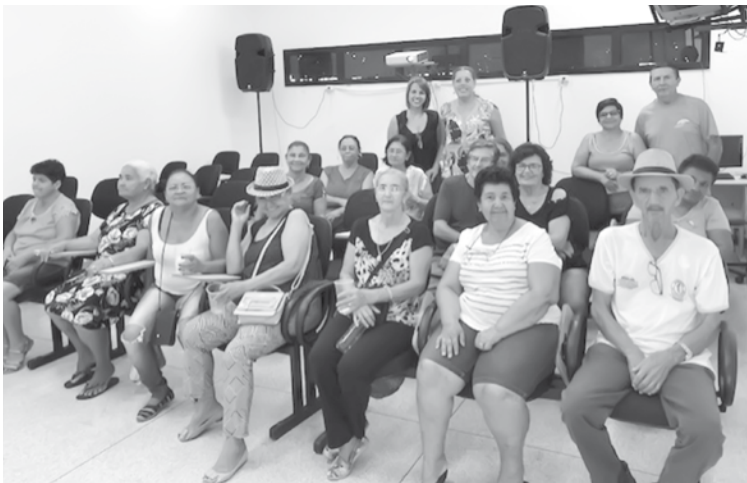
Grupo da Melhor Idade de Ouroeste participa de uma sessão de filme no auditório do Museu