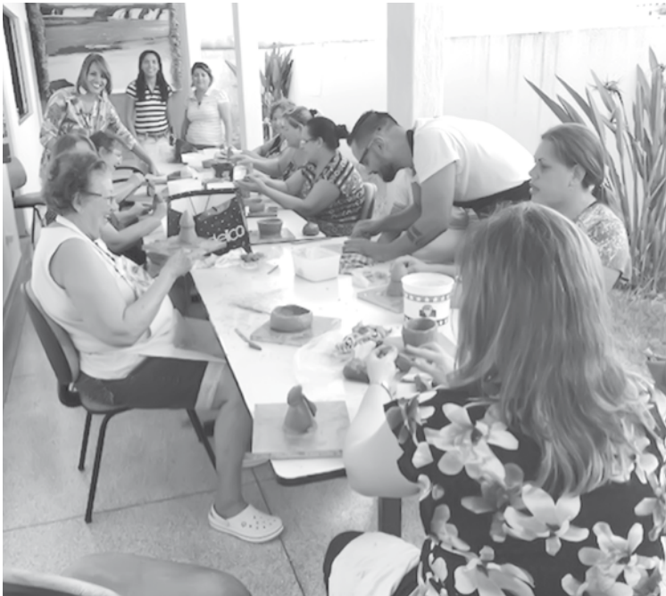
O Museu Água Vermelha segue com atividades até o dia 24 de maio