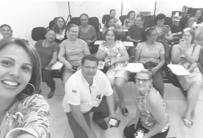
Ação educativa para idosos, onde um professor instruiu os participantes a utilizar melhor as redes sociais

tos Sarinha Veloso, com o espetáculo circense “E O PALHAÇO O QUE É?”. E encerrando a semana, no domingo, 20, terá a exibição do filme “50 Tons de Cinza”, no auditório do Museu Água Vermelha, das 15h às 18h, com entrada proibida para menores.