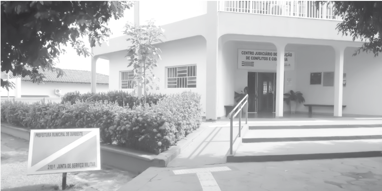
Junta de Serviço Militar de Ouroeste está localizada na Rua Brás Cubas, 1315.

Os jovens que perderem o prazo pagarão multa e taxa. O alistamento é obrigatório e o descumprimento poderá impossibilitar o cidadão a realizar atividades legais como: retirar passaporte, matricular-se em faculdade, ingressar no serviço público, candidatar-se na carreira política, obter registro de trabalho com carteira assinada, entre outros. O atendimento na Junta de Serviço Militar é das 08h às 11h e das 13h às 17h.