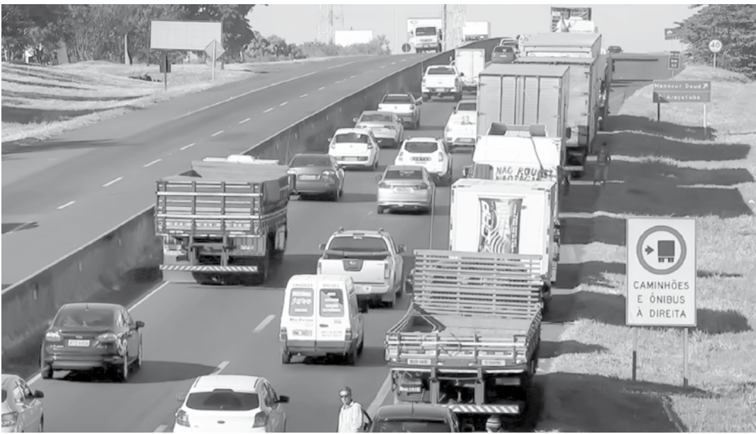
Caminhoneiros pararam no acostamento da BR-153 no trecho urbano de Rio Preto

100 caminhoneiros ficaram parados na chegada à cidade, na rodovia vicinal que liga a Catiguá (SP). O movimento foi pacífico e terminou no começo da tarde. Policiais militares acompanharam o movimento de perto. Participaram motoristas da cidade e outros que estavam pela estrada e pararam na estrada. Em Urânia, pelo menos 20 caminhões e carretas ficaram parados no acostamento próximo a uma das entradas da cidade. No local, as manifestações começaram na segunda-feira (21). Alguns motoristas dormiram na madrugada desta quarta-feira (23) na marginal da rodovia Euclides da Cunha em apoio às reivindicações dos caminhoneiros de todo país. Caminhoneiros também protestaram em estradas nas