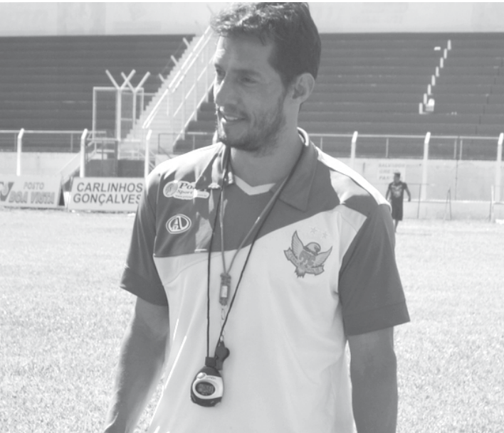
Nos campos Júnior conquistou inúmeros acessos no futebol paulista

Além do comando das categorias de base, Júnior estava sentado no banco de reservas quando o atacante Muller disputou um jogo pelo Fefecê em 2015. Saran já acertou sua ida para o América de São José do Rio Preto.