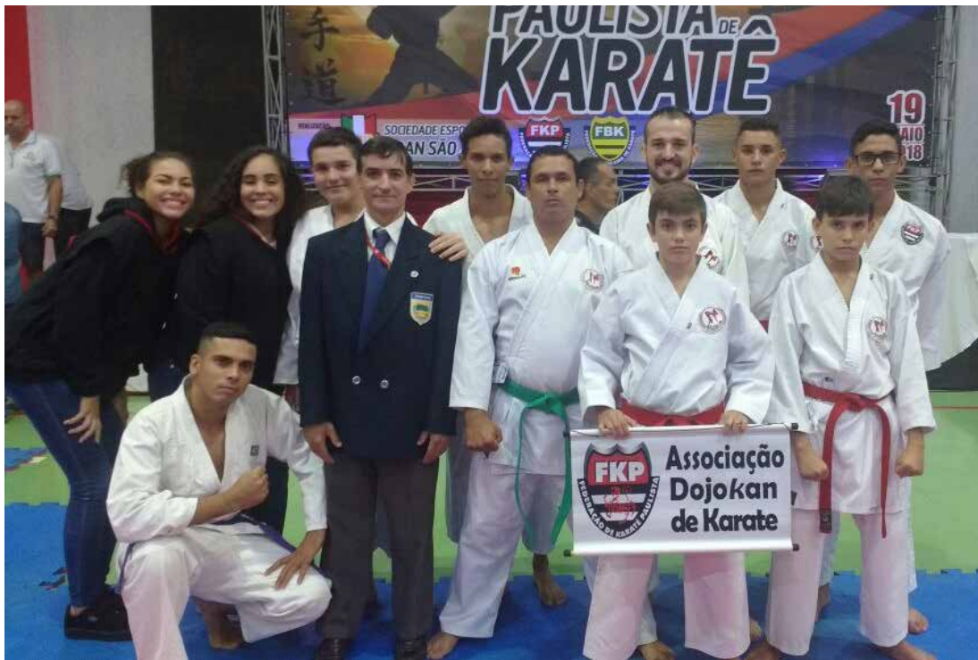
Equipe Dojokan Fernandópolis

A equipe Dojokan se prepara agora para a próxima competição que acontecerá no dia 16 de junho, na cidade de Monte Auto. Os atletas também treinam agora para o Campeonato Brasileiro, que será realizado no estado do Ceará, em setembro.