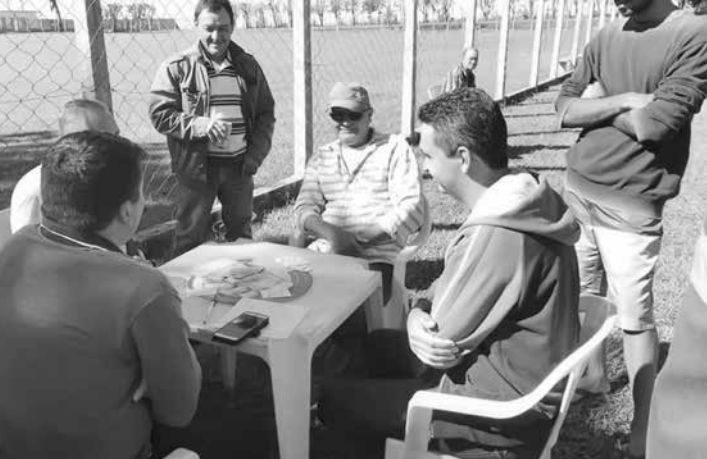
Competição aconteceu no estádio municipal