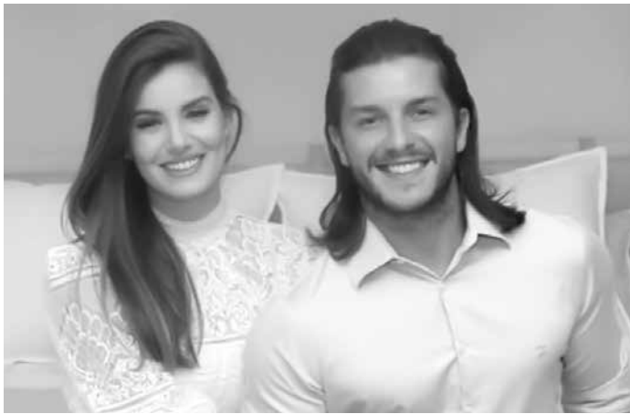
Os dois estão cuidando pessoalmente dos detalhes da festa

Segundo o colunista Leo Dias, do jornal “O Dia”, serão 200 convidados. Os noivos estão cuidando pessoalmente dos detalhes da cerimônia e pediram sigilo absoluto a quem está cuidando da organização. Fernando Avelar será o cerimonialista.