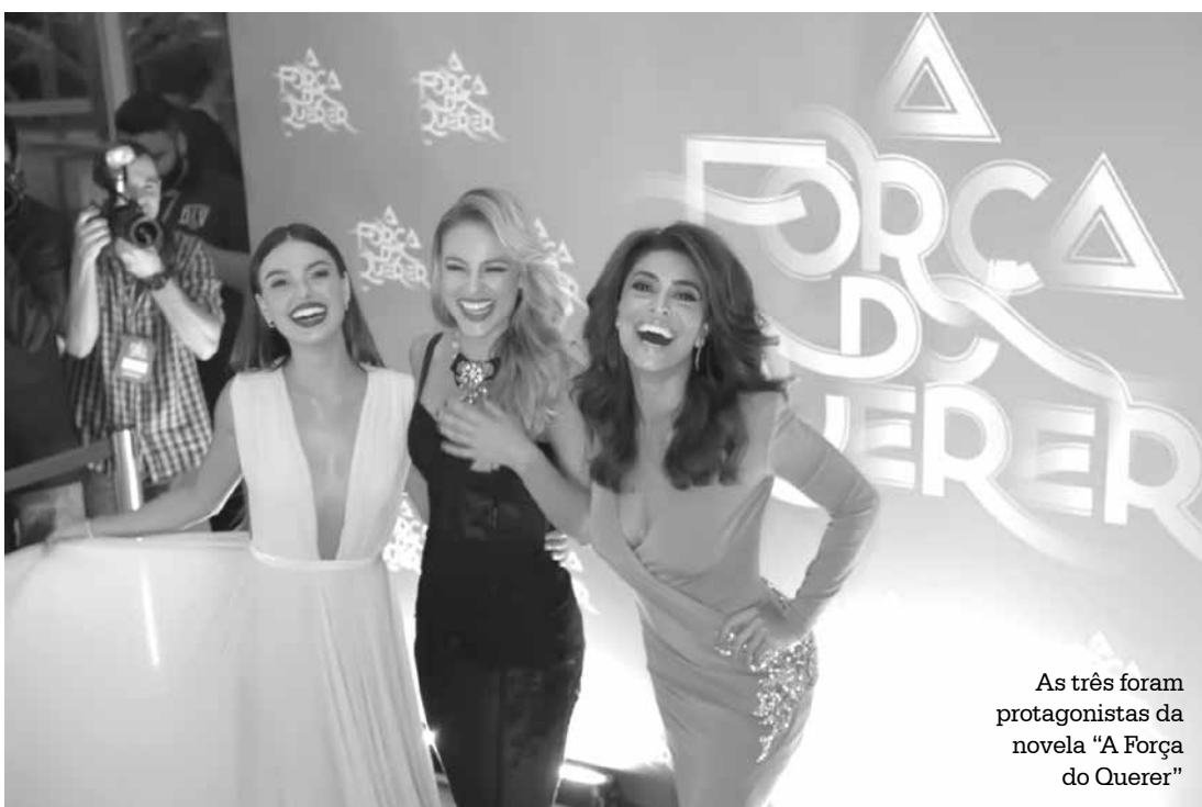
As três foram protagonistas da novela “A Força do Querer”

A lembrança de Isis Valverde com Juliana Paes e Paolla Oliveira rendeu muitos elogios entre os seguidores da futura mamãe de primeira viagem que está à espera de um menino. “Trio de musas”, escreveu uma fã. “É beleza que vocês querem? Depois dessa eu vou até sair do Instagram”, brincou outra. “Dúvida de quem qual é a mais linda! Socorro!!”, exclamou uma outra, exaltando a