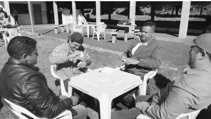
Objetivo foi popularizar a modalidade de truco, além de promover o lazer, a confraternização e o espírito competitivo