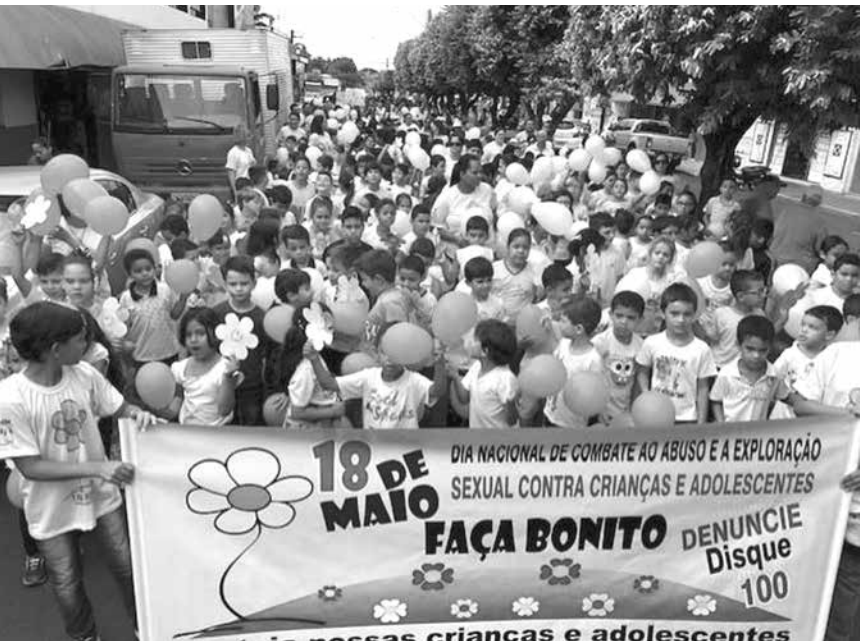
Caminhada realizada em Ouroeste para alertar a população sobre o abuso e a exploração sexual contra crianças e adolescentes

lho, EMEF de Ouroeste, Agentes de Saúde e Lions Clube, realizaram no último dia (18), uma caminhada pela principal avenida da cidade para alertar a população sobre o abuso e a exploração sexual contra crianças e adolescentes. A atividade faz parte das ações de conscientização ao