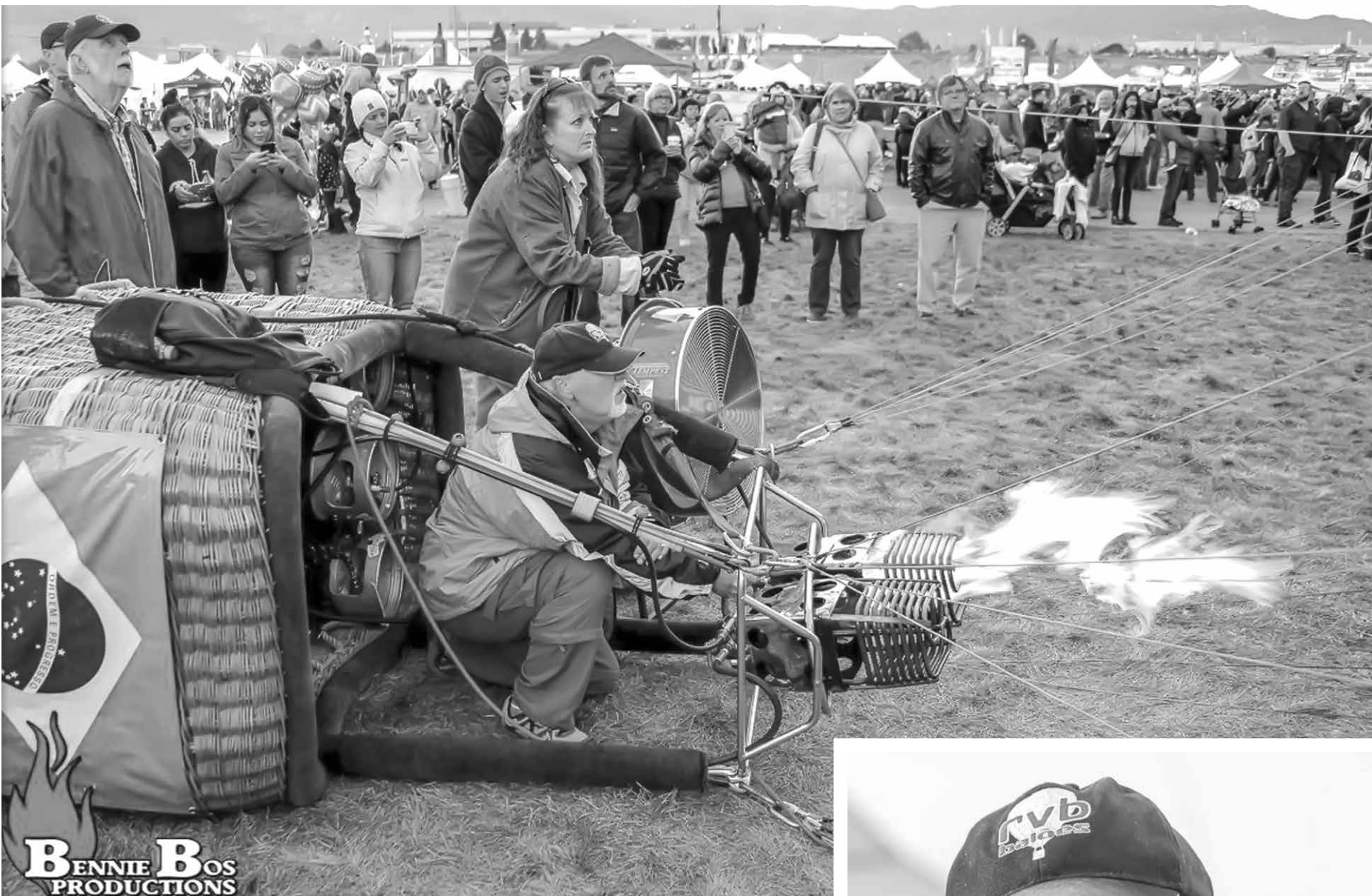
Bonimcontro durante competição do Festival de Albuquerque

Bonimcontro: Sem dúvidas! Existem vários fatores que influenciam na segurança do voo. Não somente a construção do balão é importante, mas os materiais usados também é um fator chave. Entre nós, pilotos, costumamos brincar