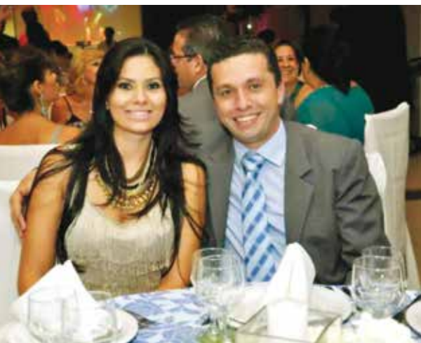
O deputado federal Fausto Pinato com a esposa Verônica , comemorou aniversário ontem. Parabéns!