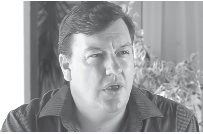
Novo prefeito foi derrotado no pleito de 2016

mação, apenas disse que não representam a vontade do povo e traíram os eleitores. Ele precisa de uma reciclagem”, destaca.