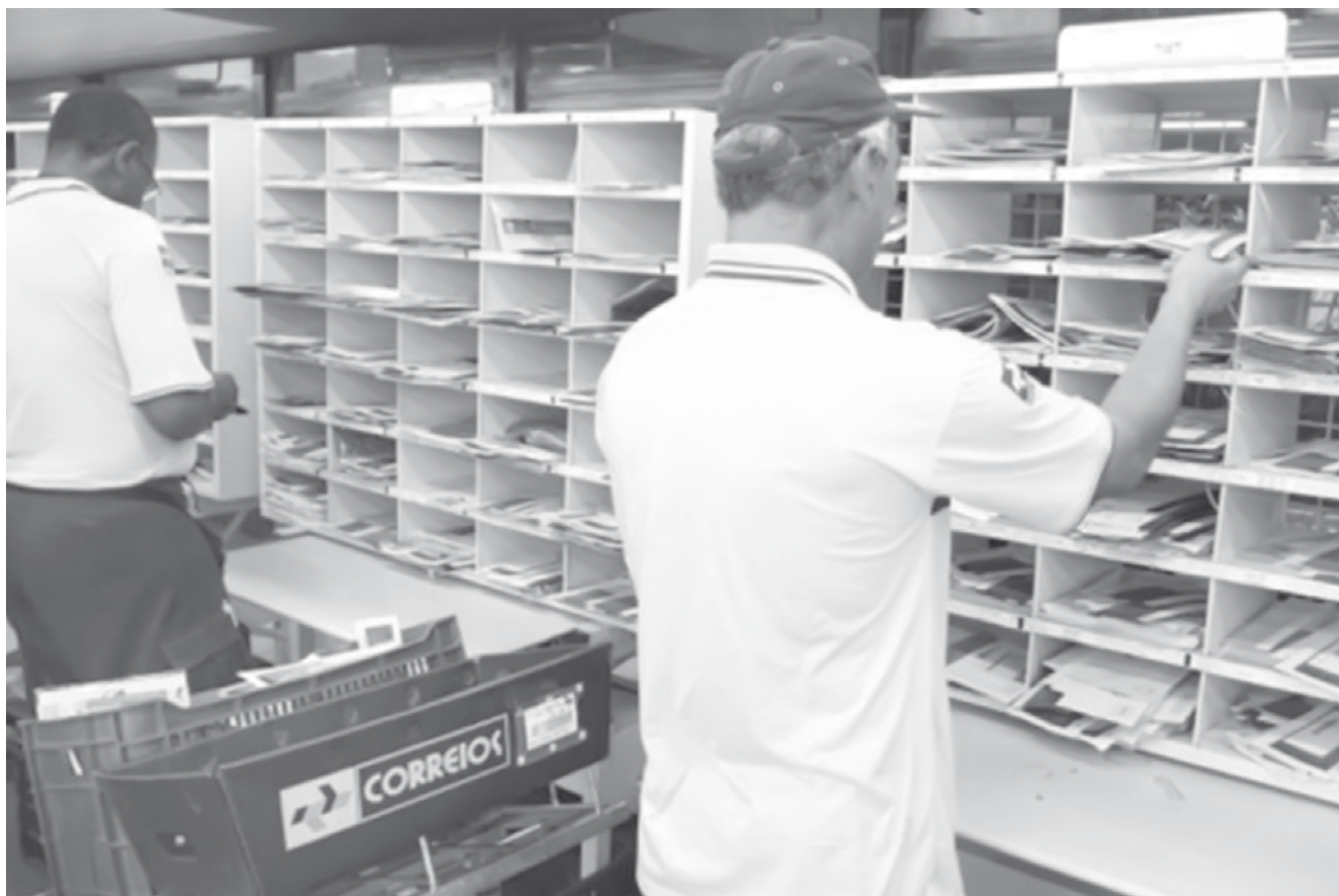
Estimativa é de que em aproximadamente 15 dias as entregas estejam normalizadas

Os serviços com dia e hora marcados (Sedex 10, Sedex 12, Sedex Hoje e Logística Reversa Domiciliária) permanecem temporariamente suspensos. Os demais serviços de encomendas como o Sedex convencional e o PAC foram mantidos e tiveram apenas o prazo de entrega ampliado. Entretanto, em todos os municípios alagoanos os transportes estão normalizados, inclusive para os serviços de coleta.