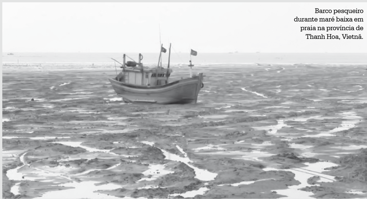
Barco pesqueiro durante maré baixa em praia na província de Thanh Hoa, Vietnã.