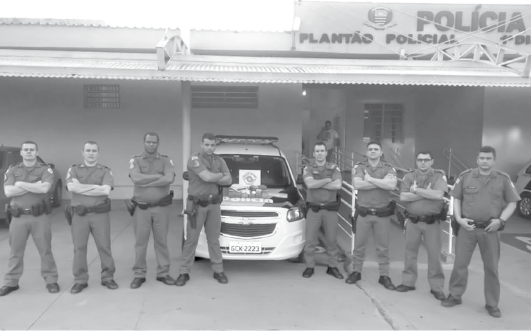
Ocorrência foi apresentada no Plantão Policial deste final de semana