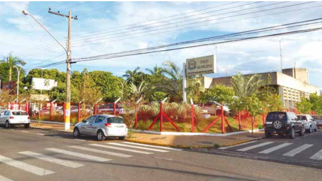
Horário de funcionamento será mantido das 7h às 13h

caminhão devem afetar a arrecadação de impostos. Com isso, será mantido o funcionamento das secretarias no horário especial das 7h às 13h. O serviço de transporte escolar, bem como os postinhos, voltam ao normal a partir desta terça-feira, 5.