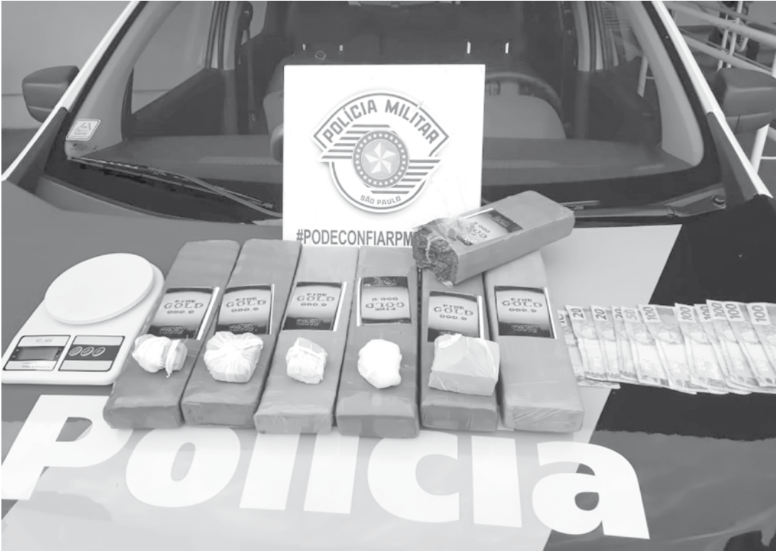
Na residência dele ainda foram encontrados dinheiro, proveniente da venda do entorpecente, e uma balança de precisão