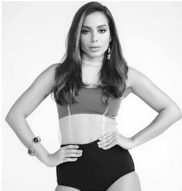
Anitta tem quase 30 milhões de seguidores

meira brasileira a fazer um “takeover” na conta do Instagram oficial - ela assumiu o Stories da empresa por um dia. A rede social tem, atualmente, mais de 240 milhões de seguidores.