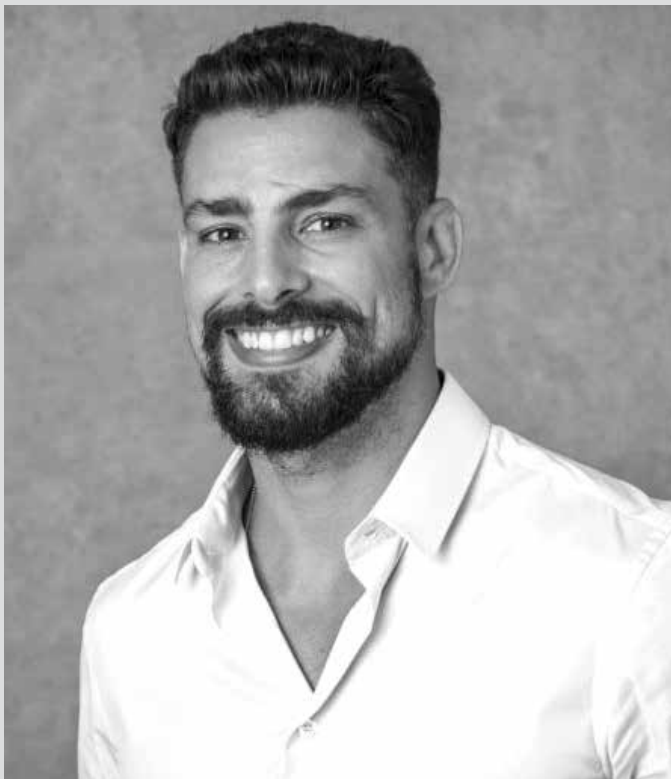
Atualmente, o ator namora a modelo e apresentadora Mariana Goldfarb

modelo Mariana Goldfarb, o galã disse que a relação com a apresentadora tem um equilíbrio bom, na qual nenhum dos dois é o mais bruto ou o mais meigo: “Todo mundo é um pouco bravo e um pouco doce, depende da situação”.