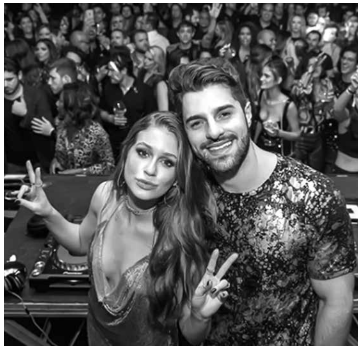
O DJ Alok foi a principal atração no aniversário da atriz

A atitude de Alok agradeceu não apenas o felizarado, mas os outros seguidores que também mandaram mensagens parabenizando a maneira como o DJ trata seus fãs.