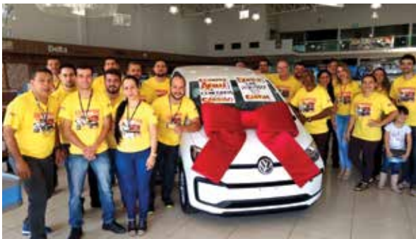
Em menos de um ano, dois clientes da Sgotti foram contemplados com um carro zero km e outros prêmios

de variedade de produtos, mantendo a tradição de bons preços e bom atendimento.