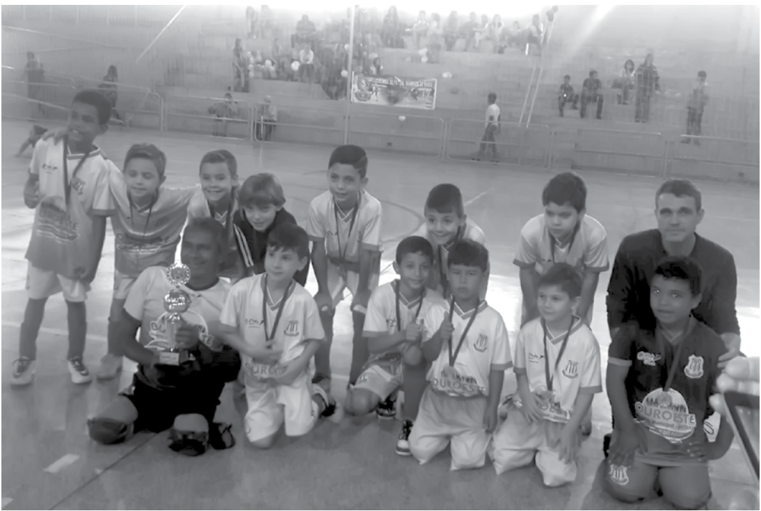
Equipe sub-08 do “Real Bagi”, campeã da 1º Copinha de Futsal Infantil