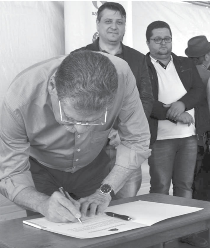
Secretário estadual de Saneamento e Recursos Hídricos esteve nesta sexta-feira, 13, em Fernandópolis