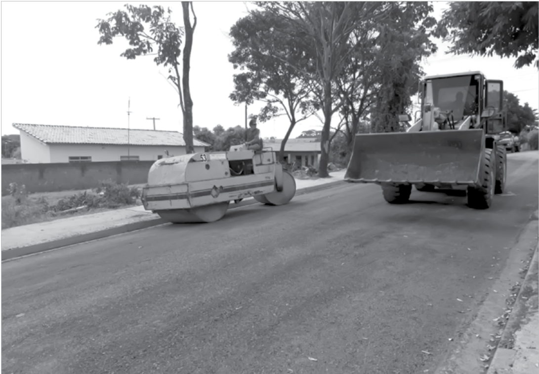
Recursos possibilitarão que Fernandópolis tenha 100% de asfalto e que diversas áreas sejam recapeadas

A verba, juntamente com os R$ 5 milhões liberados pela Caixa Econômica Federal no começo do mês, e outras emendas parlamentares, faz