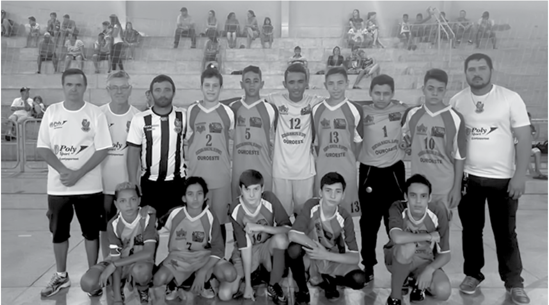
Atletas da Escolinha “Meninos de Ouro” da categoria sub-14, que venceu na grande final da copinha