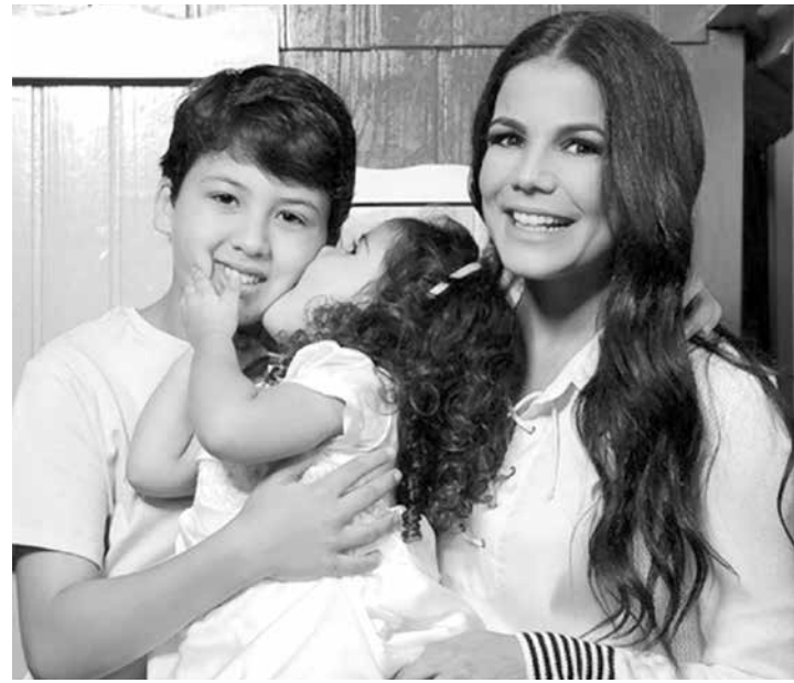
Nívea Stelmann e os filhos

Afastada da TV, Nívea revelou que tem saudade da TV. “Muita gente dizia ‘você é louca, deixar 20 anos de carreira?’. Tenho muita saudade do Brasil, dos meus amigos e de atuar. Minha vida foi novela, não sei fazer outra coisa. E quando escolhi Orlando, não estava focada em atuar lá, Se não teria escolhido Los Angeles”.