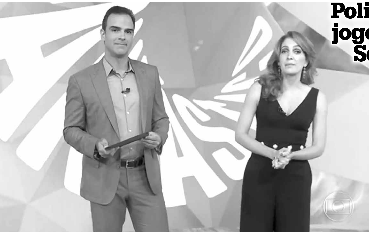
Os apresentadores Tadeu Schmidt e Poliana Abritta no Fantástico

mesmo grupo de amigos”, diz um comunicado enviado pela representante do artista.