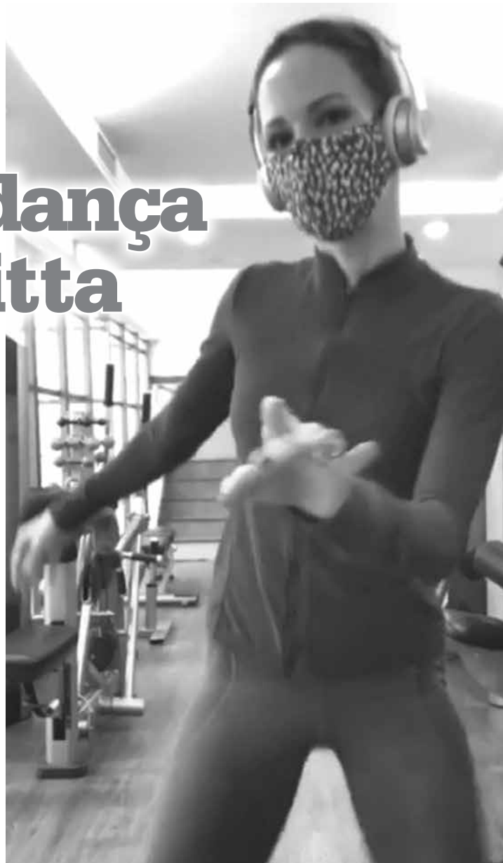
Ana Furtado dança música de Anitta com máscara estampada

Aos 44 anos, Ana passou por uma cirurgia de retirada de um tumor no dia 27 de maio e começou a fazer sessões de quimioterapia como parte do tratamento. “Foi um baque muito grande quando recebi a notícia. Mas apesar de tudo, busquei de todas as minhas formas, toda minha coragem, toda minha fé, toda minha esperança para conquistar a minha cura. E também agradecer muito a Deus pelo fato de sempre estar muito atenta à minha saúde e fazer com regularidade todos os meus exames de mama”, disse ela na ocasião.