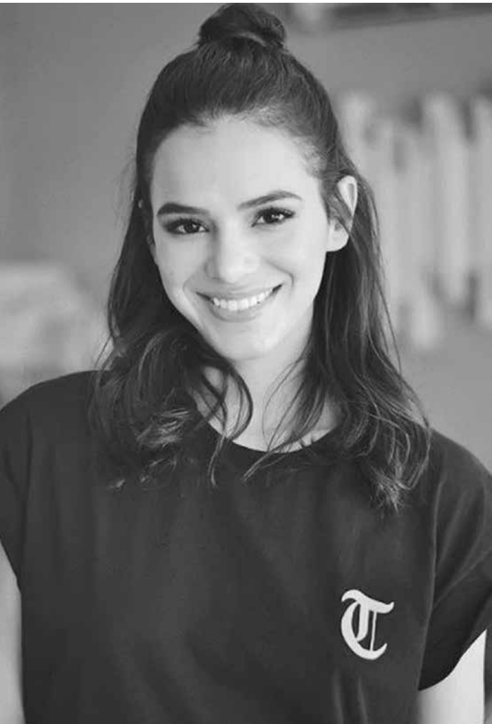
Bruna Marquezine tem se apegado à fé