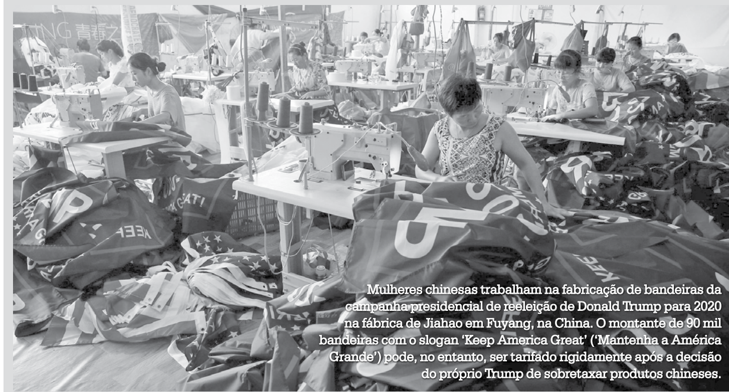
Mulheres chinesas trabalham na fabricação de bandeiras da campanha presidencial de reeleição de Donald Trump para 2020 na fábrica de Jiahao em Fuyang, na China. O montante de 90 mil bandeiras com o slogan 'Keep America Great' ('Mantenha a América Grande') pode, no entanto, ser tarifado rigidamente após a decisão do próprio Trump de sobretaxar produtos chineses.