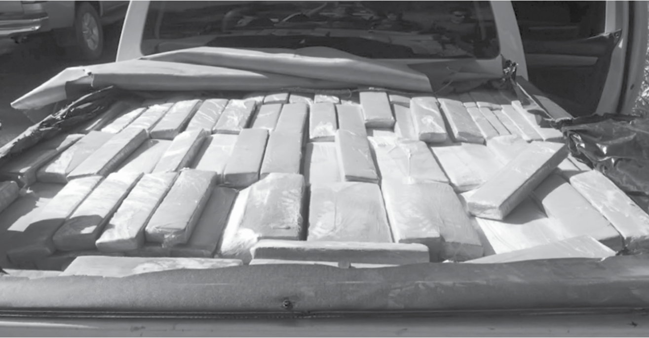
1.145 tabletes de maconha foram apreendidos

apreendidos, pesando 1.178 quilos, mais de uma tonelada do entorpecente. No carro, ainda foi apreendido nove tabletes de haxixe, pesando aproximadamente cinco quilos. O homem foi preso sendo levado à Delegacia de Polícia Civil de Monte Aprazível, onde foi autuado por tráfico de drogas. O carro usado para o transporte do entorpecente também foi apreendido, sendo identificado como veículo de roubo.