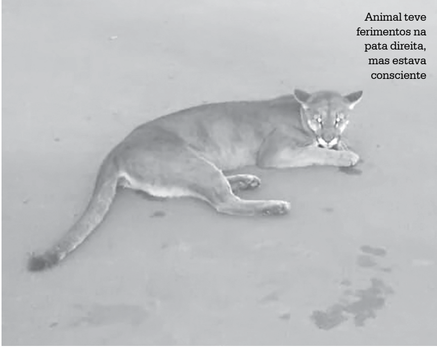
Animal teve ferimentos na pata direita, mas estava consciente