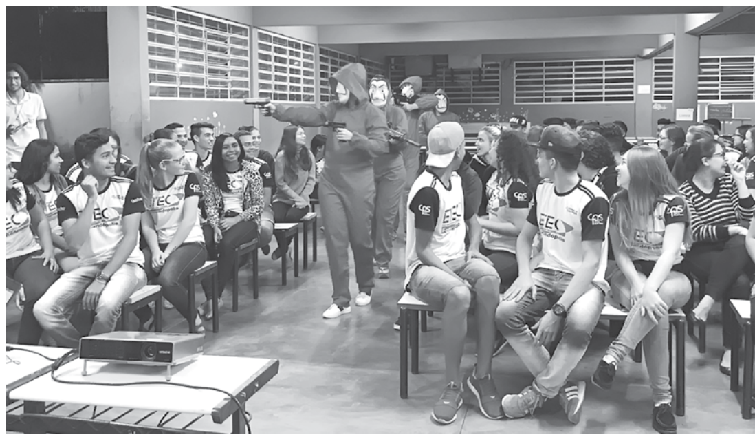
Projeto interdisciplinar deve continuar neste semestre letivo