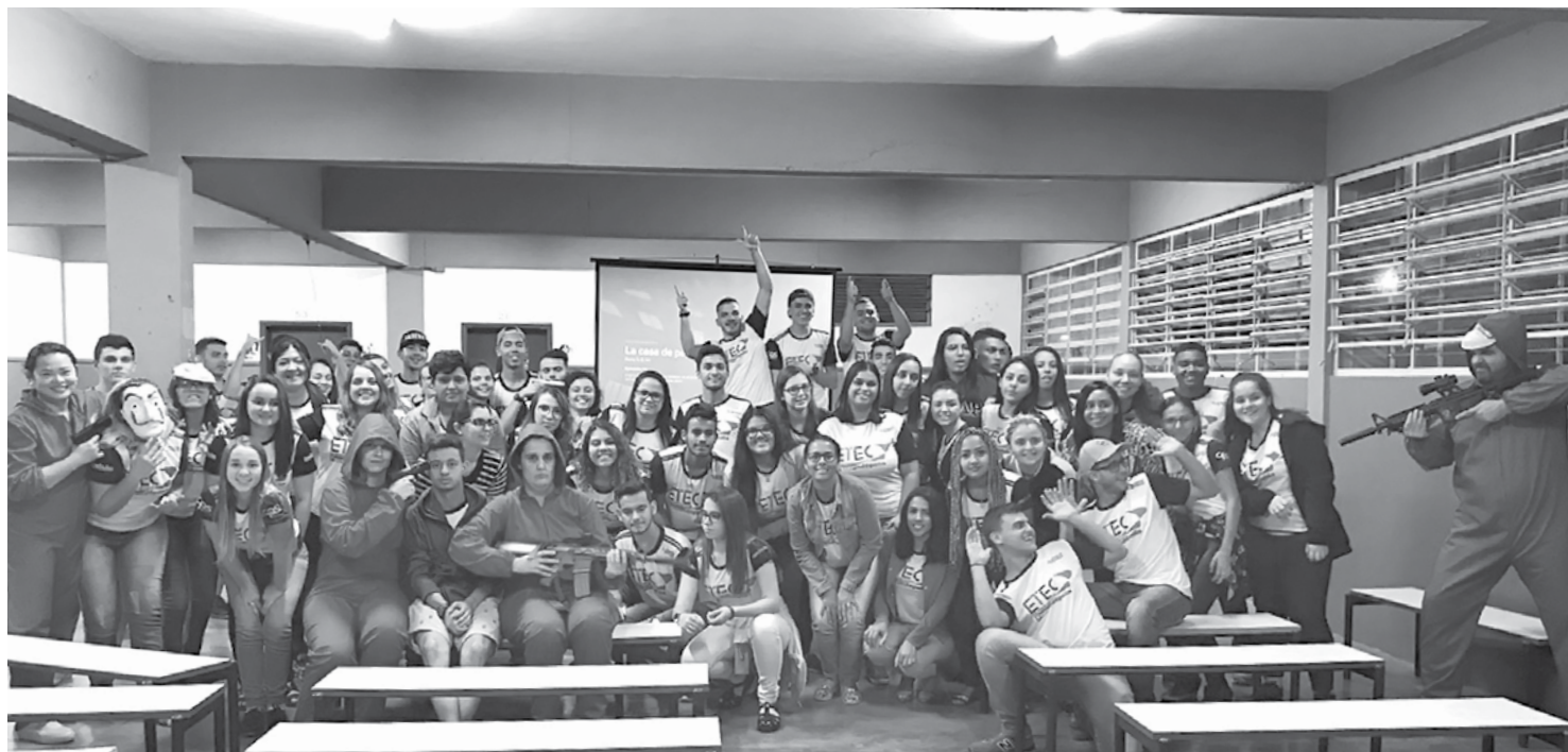
■ PROJETO INTERDISCIPLINAR

E por falar em saúde, a realidade virtual já está transformando também a experiência da vacinação infantil, por exemplo. Com a tecnologia, as crianças utilizam os óculos ao chegarem na clínica e são transportadas para um ambiente lúdico enquanto a enfermeira prepara a vacina. Pelas lentes, as crianças não enxergam nenhuma agulha ou seringa, apenas imagens de heróis.