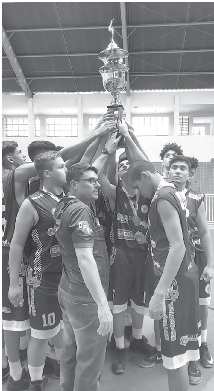
Atletismo ACD masculino brilha na competição e conquista mais 12 prêmios

semestre cheio de competição. Muito obrigado a toda diretoria da APAB, Secreta-