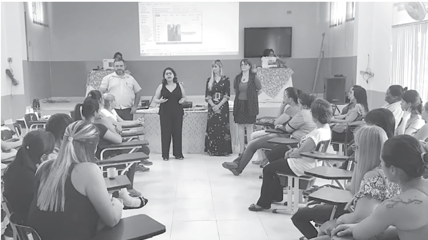
Equipe de profissionais recebendo orientações e novas técnicas de trabalho

o educar e o cuidar, o papel da berçarista é fundamental, completa. Dentro do calendário de formação dos profissionais da rede municipal de ensino, que acontece nesse mês de julho, nesta terça-feira foi a vez das berçaristas passarem pelo processo de qualificação. Além da pauta da reunião que abordou diferentes temas, com instruções, sugestões, competências e regi-