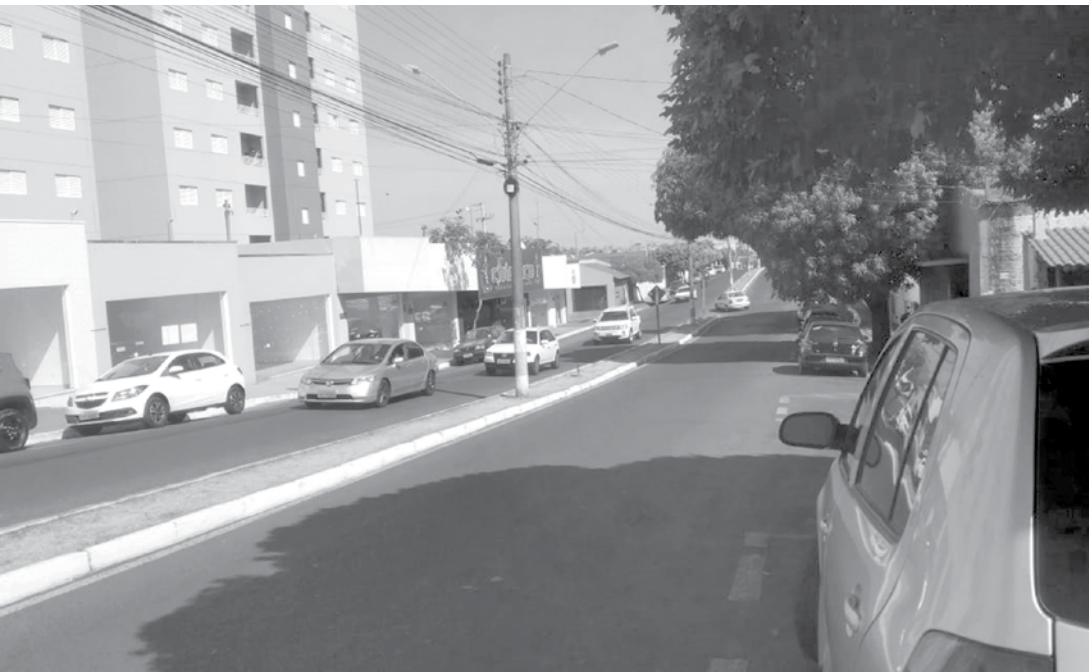
Motorista que teve a CNH retida precisa cumprir prazos e pagar por emissão de novo documento em caso de cassação

gem, é tudo muito demorado e burocrático”, afirma. Um motorista pode perder o direito de dirigir de duas formas: tendo a habilitação suspensa ou cassada. Para voltar a guiar, em ambos os casos, é preciso fazer um curso de reciclagem e cumprir o prazo previsto pela legislação, que varia de seis meses a dois anos, dependendo da gravidade das infrações. A assessoria informou que atualmente o tempo mínimo de suspensão de dirigir é de seis meses e que “a lei mudou em novembro de 2017. Antes, o mínimo era de um mês, dependendo das infrações e do histórico do condutor”.