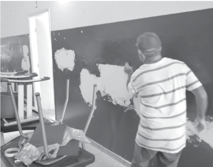
Escolas recebendo reparos e reformas pela equipe de Obras da Prefeitura

da Secretaria de Obras, estão sendo feitas a substituição de lâmpadas e instalação de equipamentos em todas as unidades que necessitam do reparo. A previsão da Prefeitura de Fernandópolis é que todas as escolas sejam beneficiadas com as ações de melhorias.