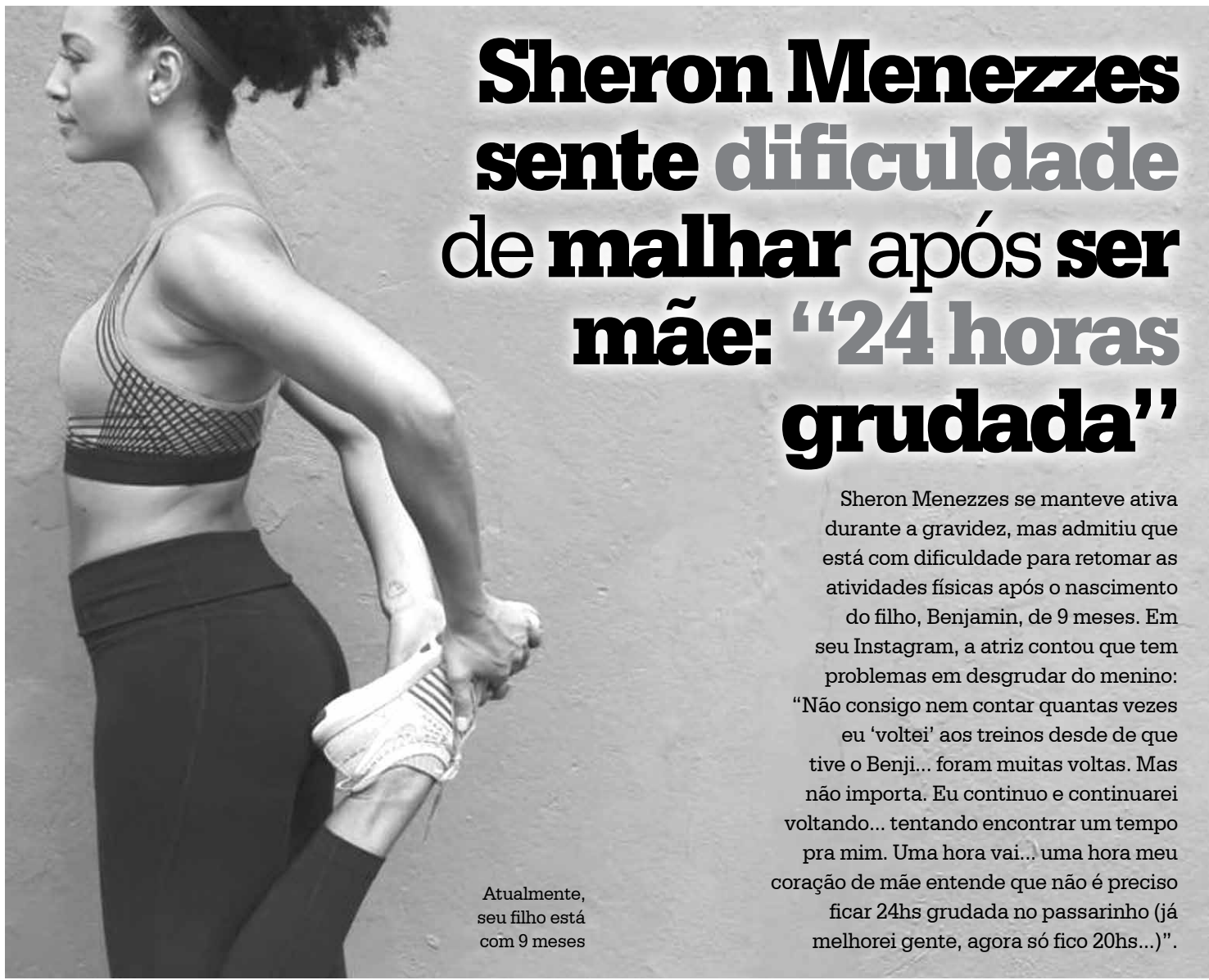
Atualmente, seu filho está com 9 meses