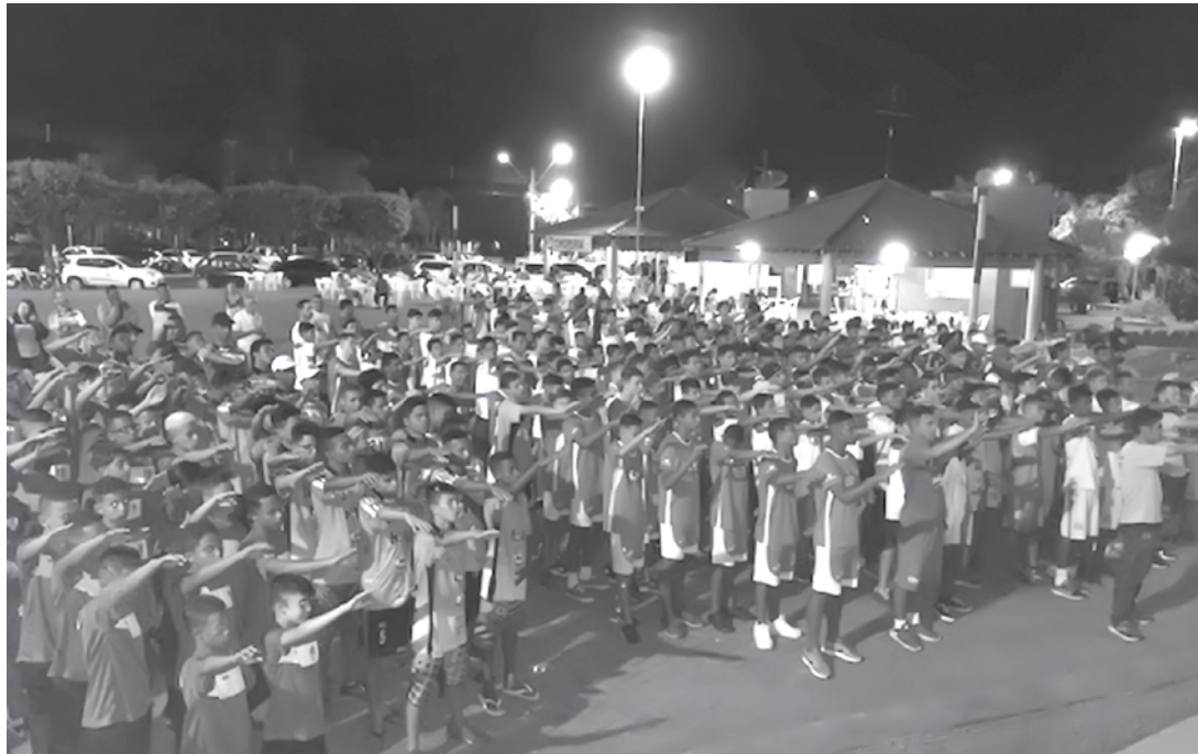
Cerca de 600 atletas participaram da abertura oficial da Copa