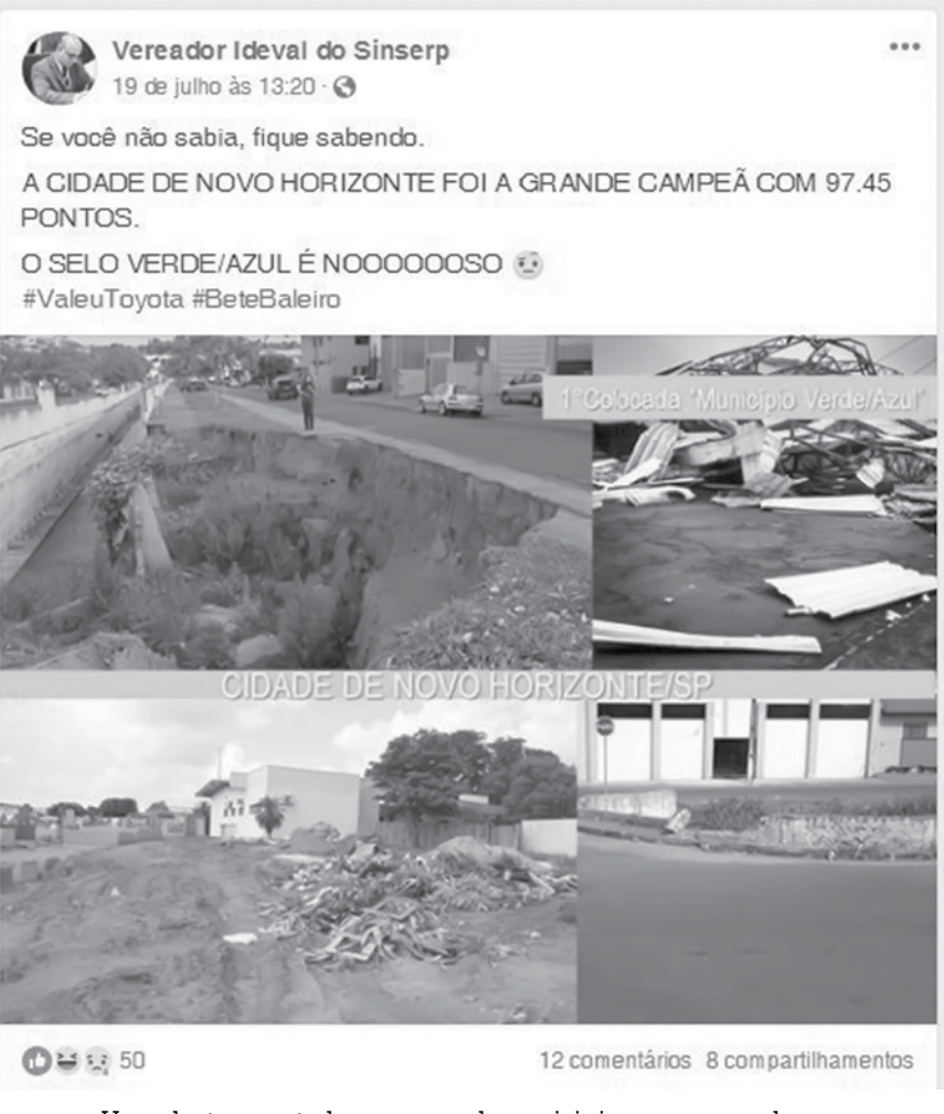
Vereador tem postado em suas redes sociais imagens que colocam em dúvida a posição de Novo Horizonte no Selo VerdeAzul