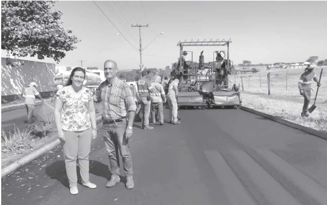
Cerca de 37 mil metros quadrados de vias públicas irão receber as obras de recapeamento

a transitar em ruas sem buracos e imperfeições, que consequentemente garante uma melhoria da trafegabilidade na cidade.