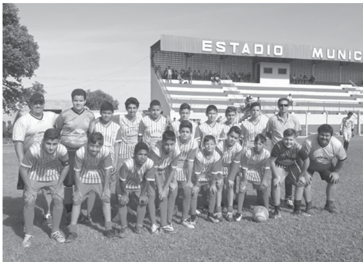
A equipe sub-11 de Ouroeste já foi confirmada como finalista da Copa