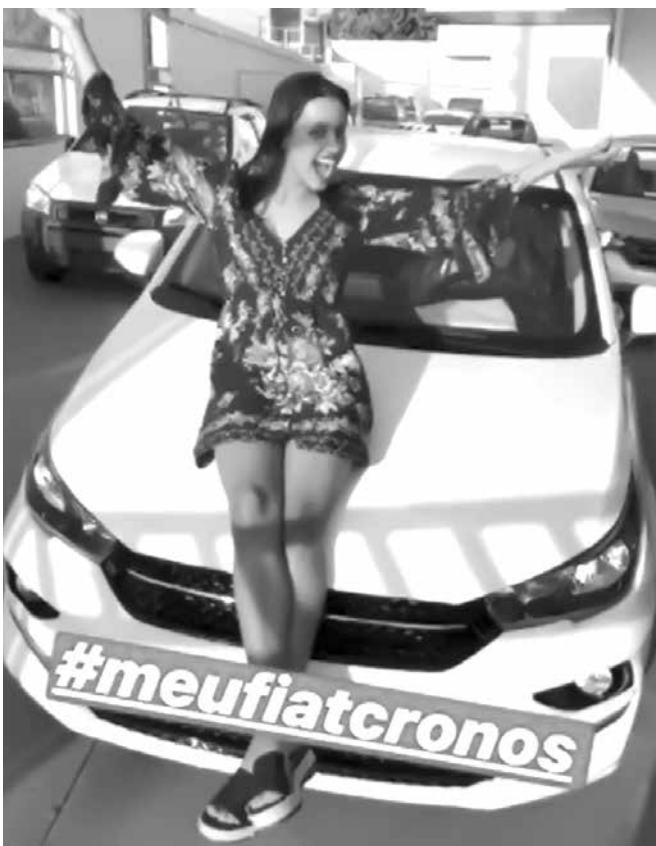
As duas lamentaram o fato de ainda não saberem dirigir