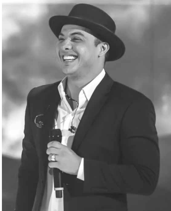
Segundo o cantor, o valor acordado é o mesmo que ele já pagava

mir com o meu filho, que ele pudesse conviver com a minha família. Essa questão de ser injustiçado, eu acho que sim. E às vezes eu ficava chateado porque assim: estou uma quarta-feira em casa e queria estar com ele, mas não era possível. Então assim: o que você quer? Quero mais flexibilidade com meu filho. Vamos se acertar aqui, está resolvido, bom para os dois...”, disse.