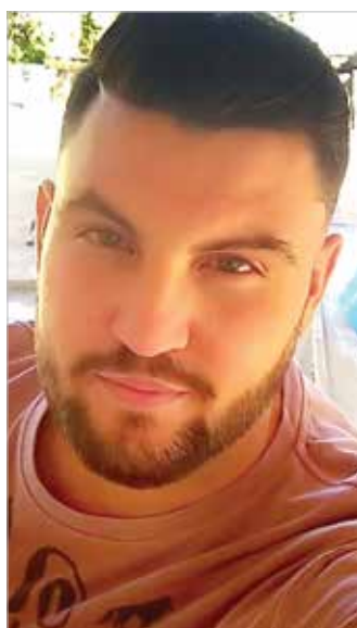
Victor Hugo celebrou a chegada da nova idade nesta sexta-feira.