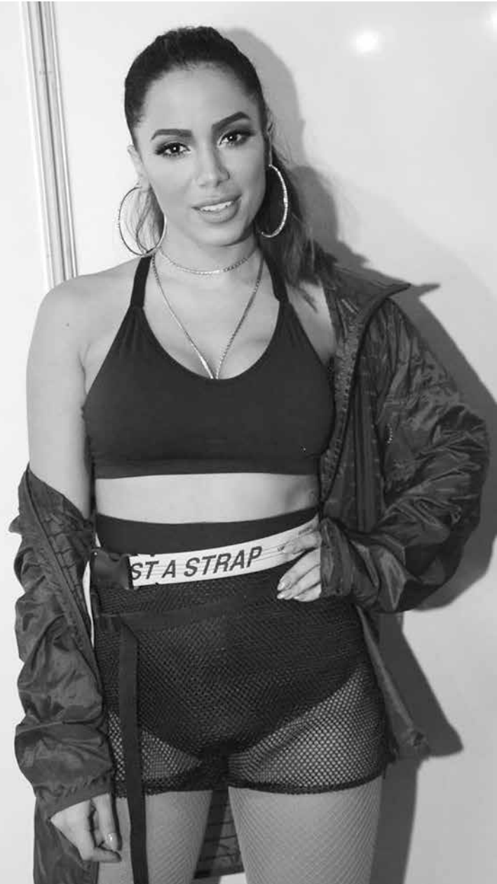
A série estreia com 10 episódios