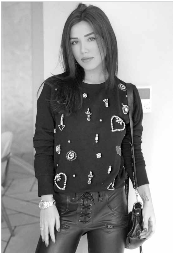
Digital influencer está com apenas 14 semanas