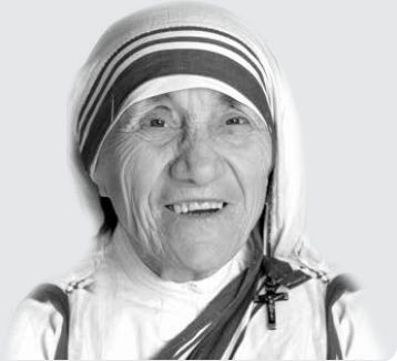
MADRE TEREZA DE CALCUTÁ

e remou com todo vigor. Novamente o barco girou em sentido oposto, sem ir adiante. Finalmente, o velho barqueiro, segurando os dois remos, movimentou-os ao mesmo tempo e o barco, impulsionado por ambos os