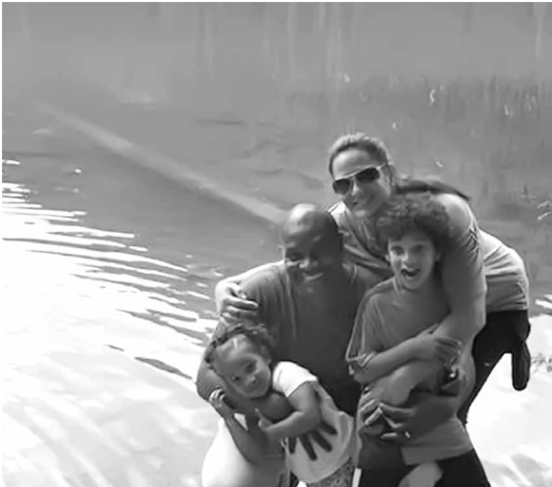
Jacaré ao lado da mulher e dos filhos

O último trabalho divulgado em suas redes sociais são fotos para a campanha de uma empresa de intercâmbios, comandada pela própria esposa.