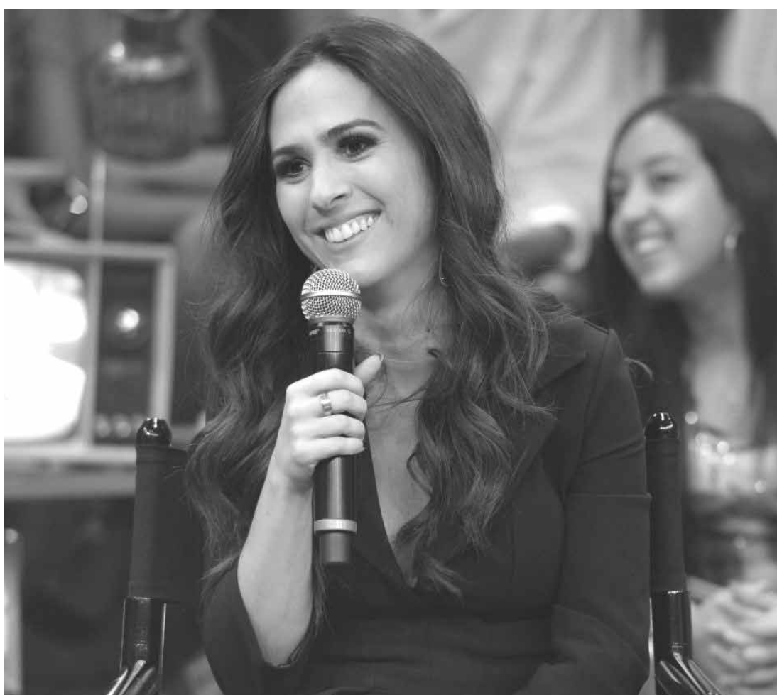
Segundo Tatá, ela não possui intervenções cirúrgicas no rosto

Tatá Werneck está curtindo férias em Fernando de Noronha acompanhada de Rafael Vitti. Em seu perfil do Instagram, a atriz tem compartilhado fotos pelo arquipélago pernambucano e causado suspiros nos seguidores ao exibir o cenário paradisíaco. Em imagem postada nas redes sociais, a artista se deparou com uma crítica por mostrar rugas no rosto. “Que olho mais enrugado. Meu Deus, Tatá. Isso não está bom”, escreveu uma internauta. Sem perder o bom humor, a apresentadora do “Lady Night” defendeu sua aparência que, segundo ela, não possui intervenções. “35 anos sem nunca ter feito nada, só mil caretas”, disse, acrescentando com um conselho: “Acredite, vale a pena”. Em recente comemoração de seu aniversário, ela ganhou declaração apaixonada e buquê de presente do noivo.