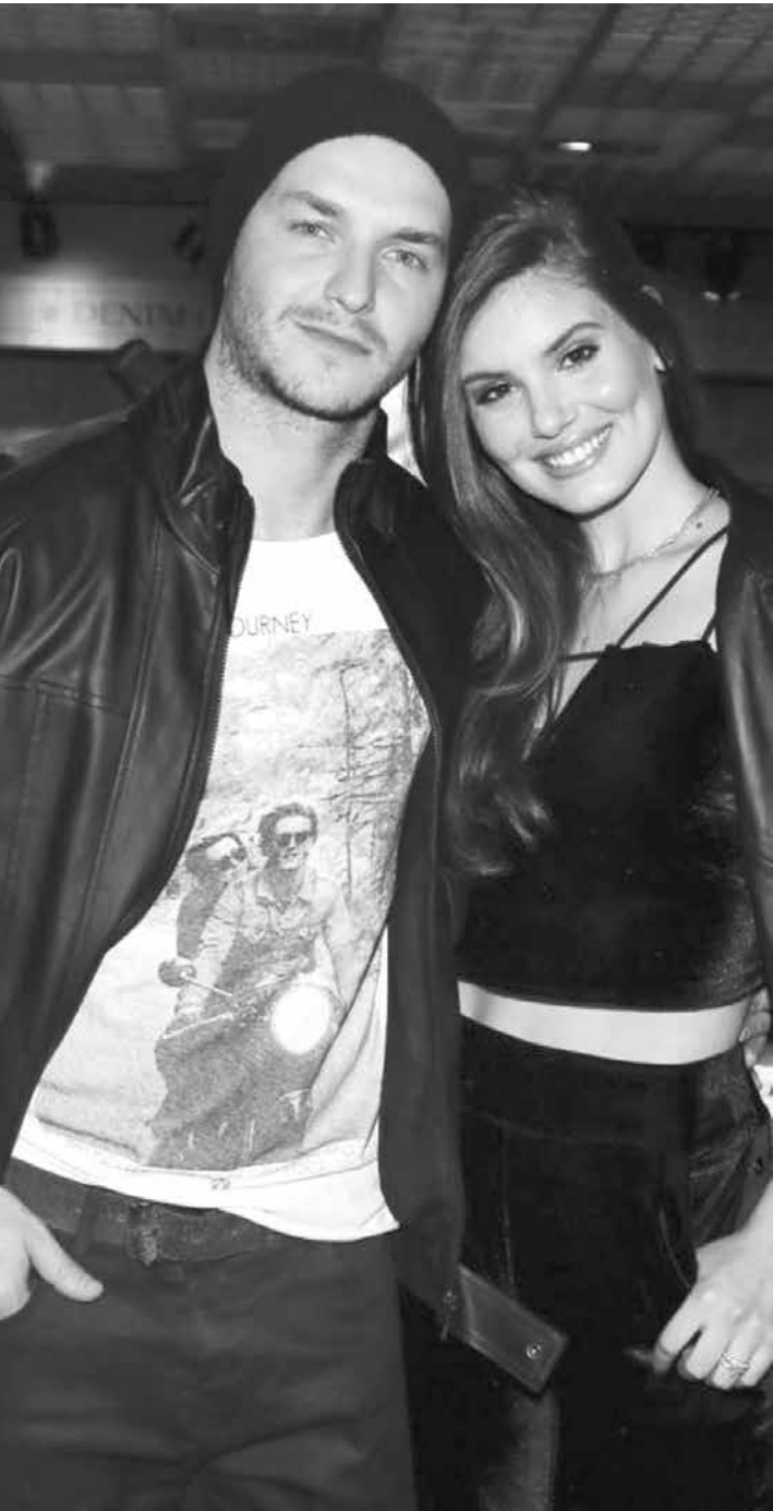
Os dois vão oficializar a união no dia 25 de agosto