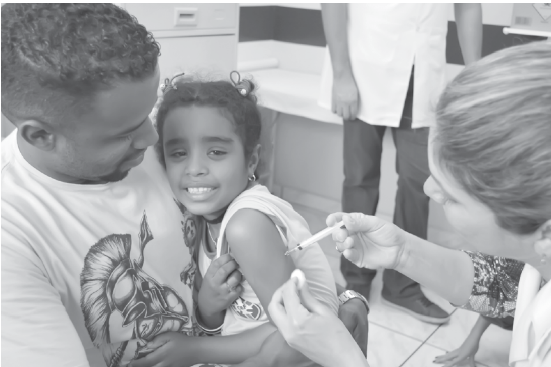
Unidades de Saúde estarão abertas das 08h às 17h

alertou que 312 municípios brasileiros estão com cobertura vacinal abaixo de 50%