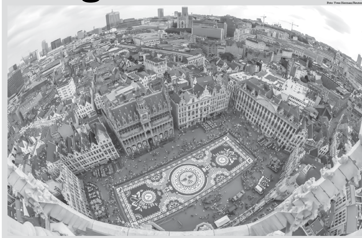
imagem do dia

Um tapete de flores com 1800 m 2 é exibido em praça de Bruxelas, na Bélgica. Com o tema 'Guanajuato, orgulho cultural do México' e composto com cerca de 500 mil dalias e begônias, o tapete foi montado na Grand Place, em frente à Prefeitura, no centro da cidade