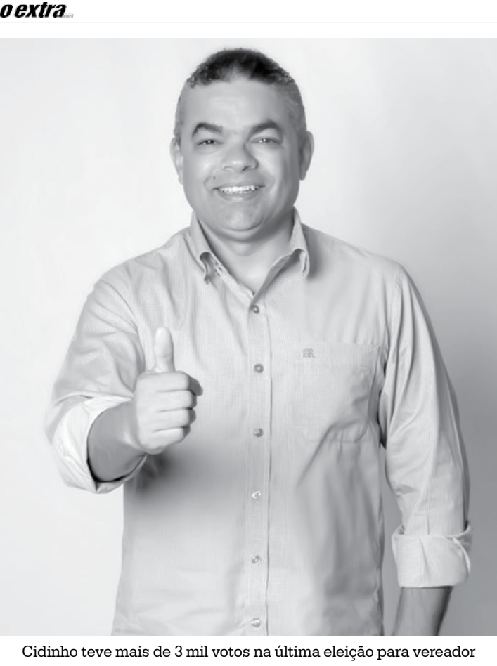
Cidinho teve mais de 3 mil votos na última eleição para vereador