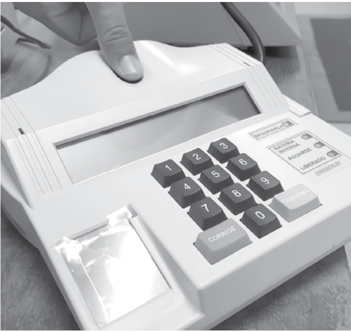
Campanha do cadastramento biométrico começou em 2008, mas apenas se intensificou em anos posteriores

ra 8,2% (cerca de 12 milhões de eleitores) do conjunto de eleitores aptos a votar em 2018. BIOMETRIA E REVISÃO ELEITORAL Outro fator que pode ter influenciado a diminuição dos eleitores com voto facultativo é o processo de cadastramento biométrico, iniciado pelo TSE em 2008. Isso porque, durante o cadastro das digitais, os dados dos eleitores são atualizados no sistema do TSE. Uma das consequências dessa atualização é a modificação das informações dos eleitores, como o grau de escolaridade. Se uma pessoa era analfabeta quando tirou seu título de eleitor há 20 anos, mas já se alfabetizou durante esse período, ela constava como analfabeta no sistema até atualizar seus dados durante o cadastramento biométrico.