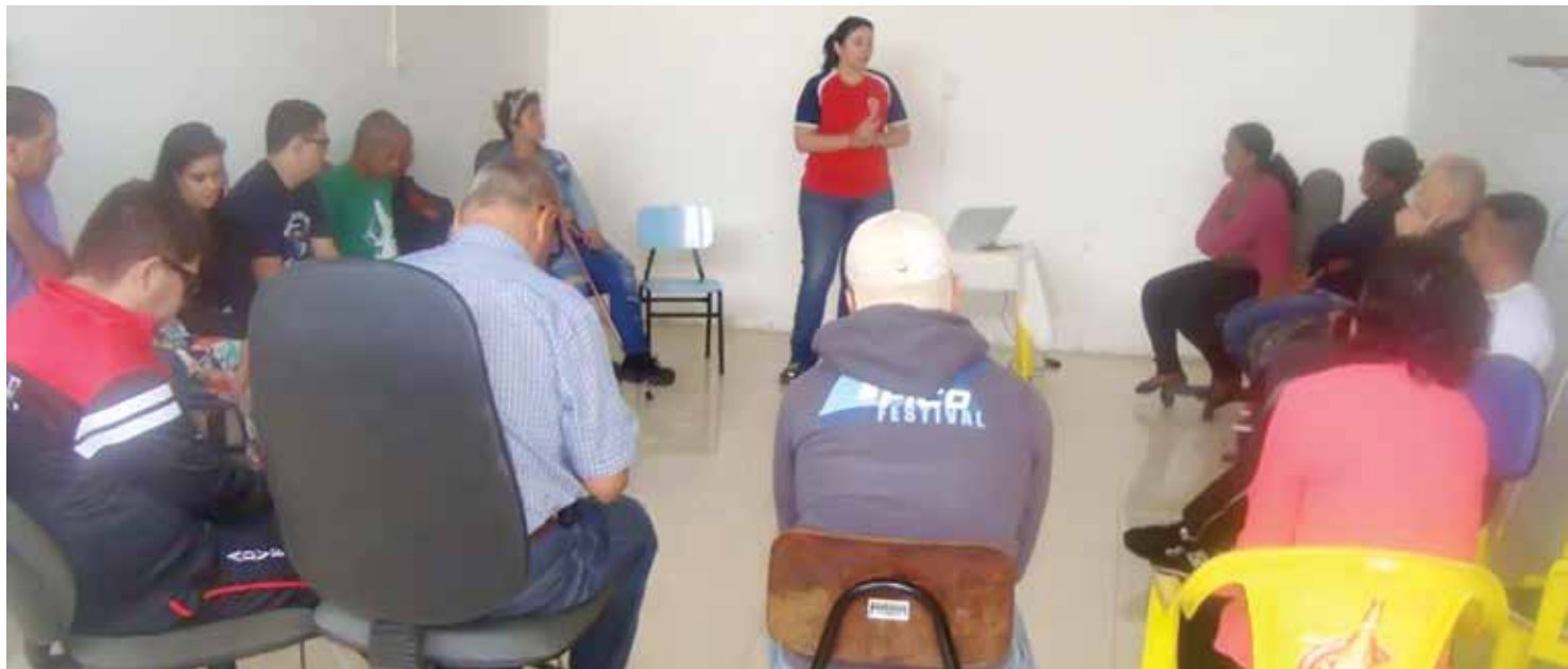
Treinamento oferecido na ADVF

já abordou outros temas, como PCR (parada cardiorrespiratória), queimaduras e OVA-CE (obstrução de vias aéreas por corpo estranho). Nesta quinta-feira, 16, foi dia de palestra aos colaboradores do AME (Ambulatório Médico de Especialidades) de Fernandópolis, que também receberam treinamento na quinta-feira da próxima semana, dia 23, no anfiteatro do Centro de Reabilitação Lucy Montoro. Instituições interessadas em receber os treinamentos oferecidos pelo SAMU devem endereçar ofício ao órgão indicando o tipo de capacitação que necessita.