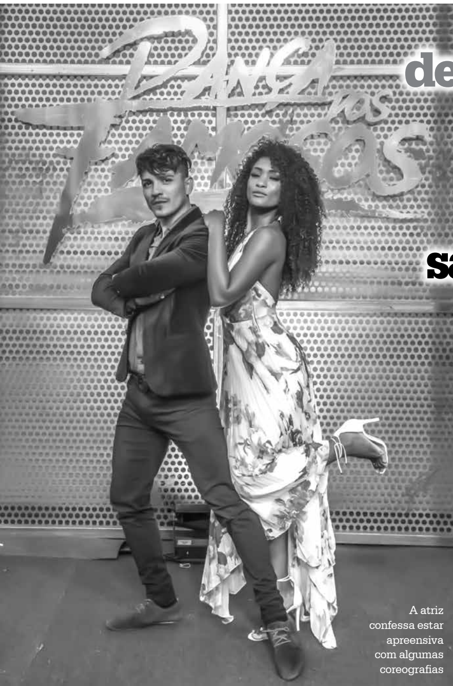
A atriz confessa estar apreensiva com algumas coreografias