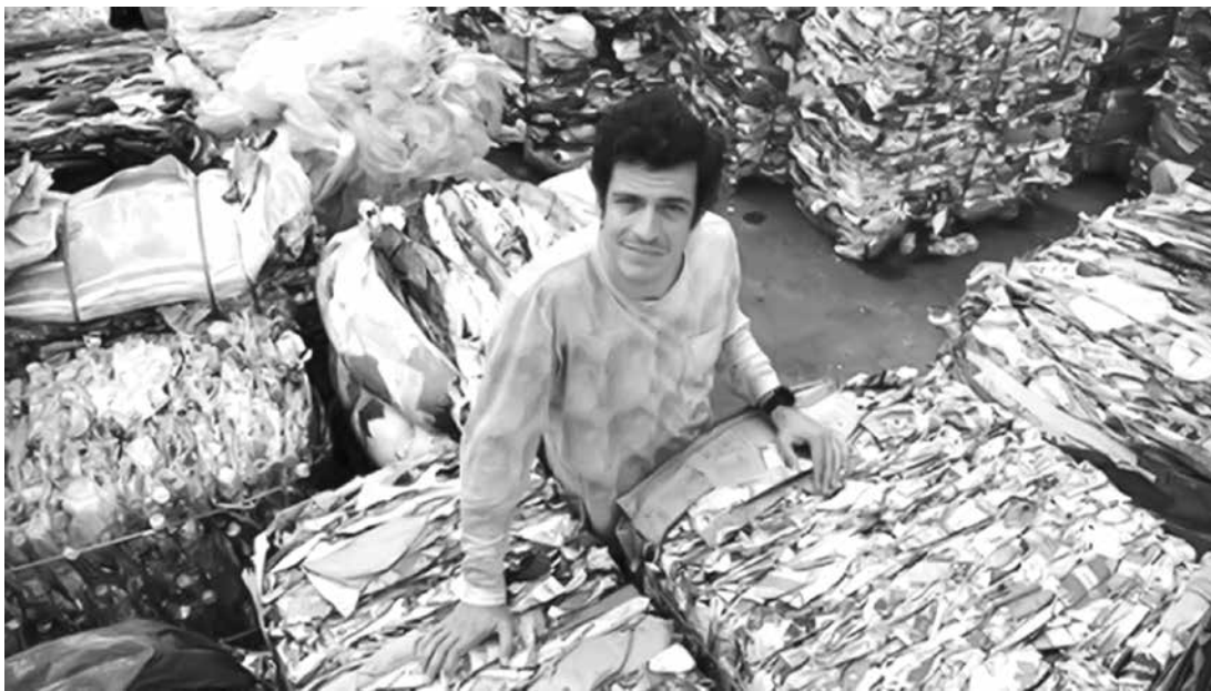
Mateus visitou a COMLURB do Rio de Janeiro

Ao postar outras fotos, Mateus Solano aproveitou para falar das dificuldades do trabalho dos catadores e escreveu em caplock, para chamar bastante atenção, para atitudes mínimas que todos podem fazer em casa.