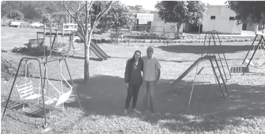
Playgrounds foram instalados em quatro lugares diferentes

segurança. De acordo com a prefeita, para que os resultados sejam comemorados, a população tem papel fundamental em colaborar na preservação destes espaços. A população tem a responsabilidade de ajudar a cuidar e conservar os brinquedos. “Pedimos que a comunidade esteja atenta e, em caso de vandalismo, denuncie. Vandalismo ao patrimônio público é crime”.