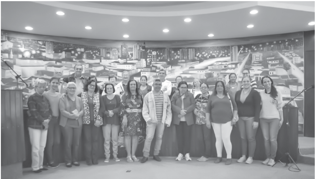
Grupo, formando por aproximadamente 20 pessoas, também conheceu as instalações da Câmara Municipal